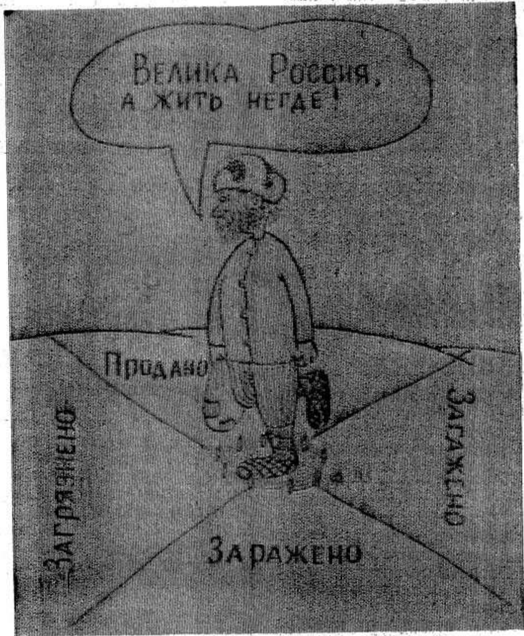
Рис. А. Талимонова. «Российская газета».