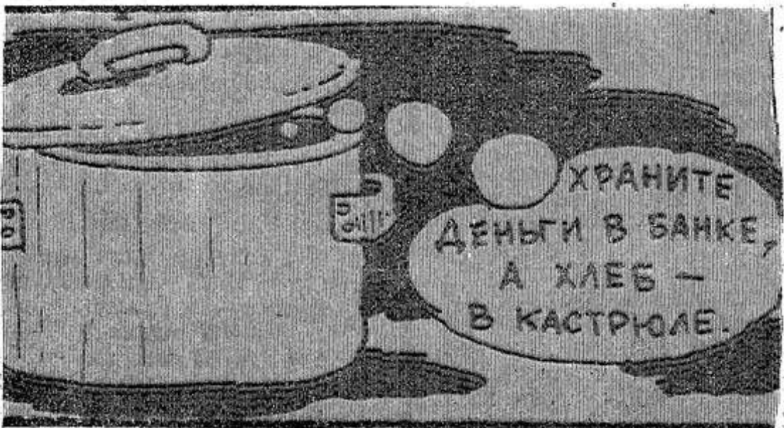
Рисунок из «Крестьянской России».