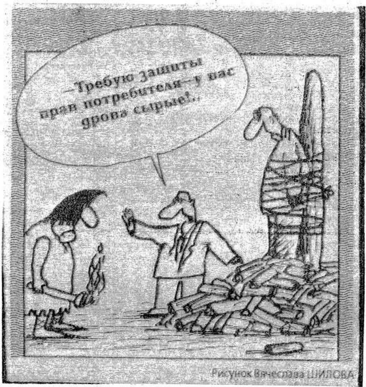
Рисунок Вячеслава ШИЛОВА

ЗАВОЗЯТСЯ эти изделия в нашу страну в основном из Австрии и Италии. Но то, что это импорт из развитых европейских стран, еще не является гарантией его качества. А поскольку ни на изделия, ни на упаковке, ни даже на гарантийном сертификате нет указаний на фирму-изготовителя (сообщается только, что произведено изделие в Италии), специалисты полагают, что это может быть неизвестно где изготовленной подделкой.