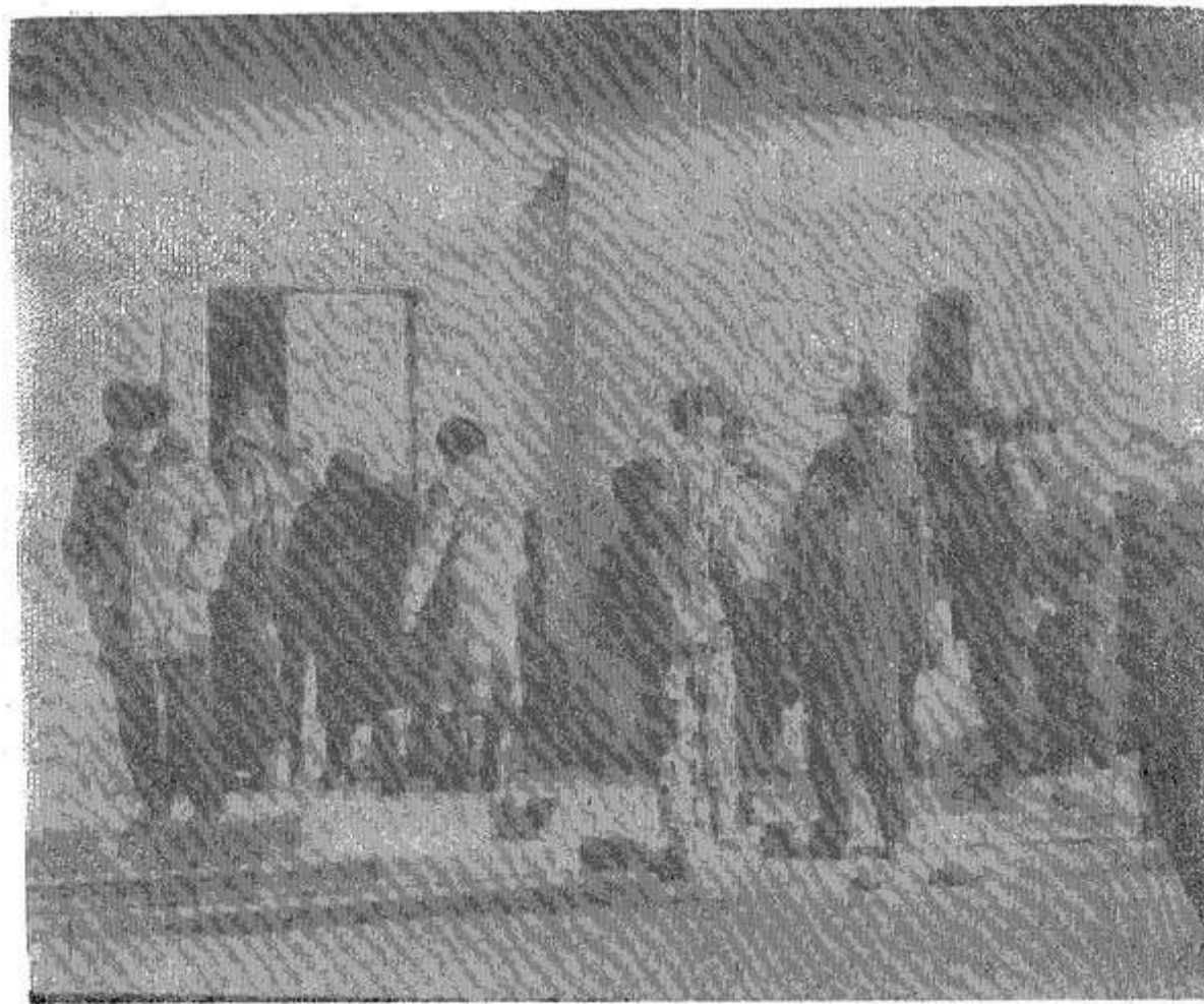
В зал на заседание.