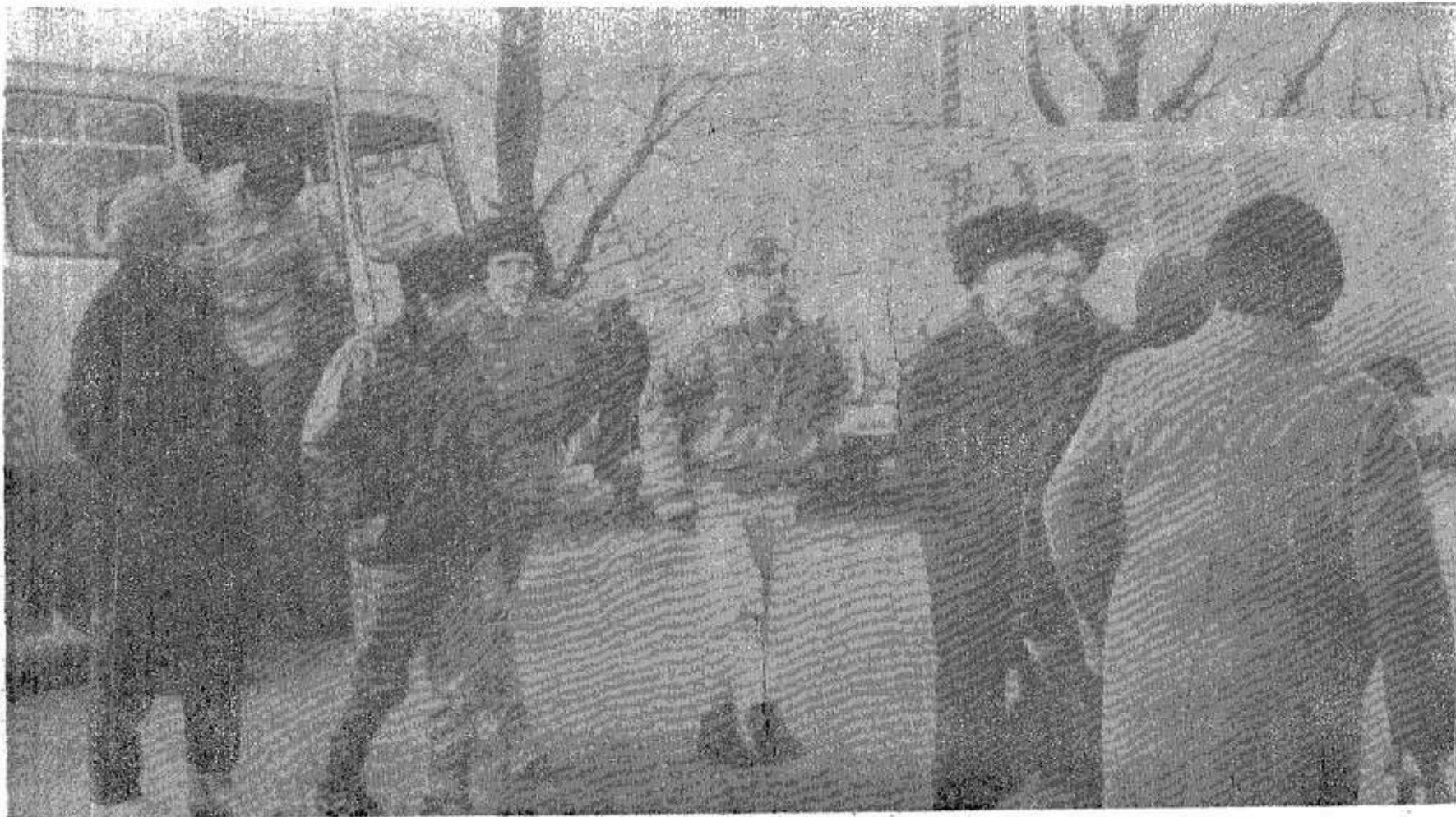
Передовики приехали на слет.

СОБРАНИЕ передовиков сельскохозяйственного производства, посвященное Дню работников сельского хозяйства, проходило в пятницу, 12 ноября, в районном Доме культуры. Почти из каждого хозяйства приехали представители всех отраслей. И по их нарядам, одежде, улыбающимся лицам не чувствовалось, что село доедает, допивает, донашивает, что наступает крах экономике и всему тому, что наживалось за социалистический период.