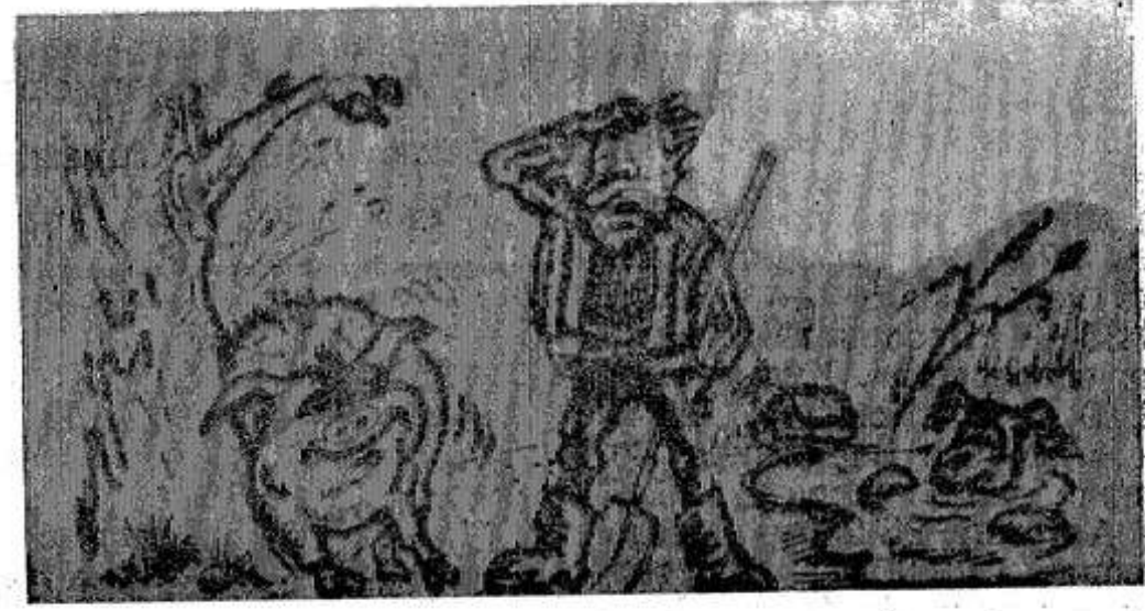
— Ну что, на «Мерседесе» проехать хочешь?