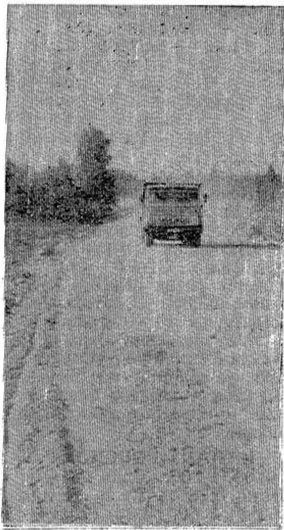
Развал колхозов и совхозов, как заявил на встрече с аграрниками Исковщины председатель Верховного Совета России Р. И. Хасбулатов, был очередной ошпикой нынешнего руководителя

За совершение мелкого хулиганства к ответственности привлечены 19 человек.