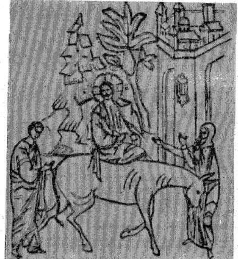
Вход Господень в Иерусалим.

12—17 апреля — Страстная неделя. Ежедневно проходят богослужения, посвященные последним дням земной жизни Спасителя и толкованию смысла совершенного им Спасения. Каж-