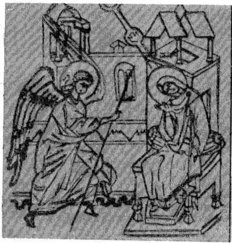
Благовещение Пресвятой Богородицы.

На апрель приходится наиболее значительные христианские праздники: два двенадцатых (Благовещение и Вход Господень в Иерусалим) и «Торжество торжеств» — Пасха.