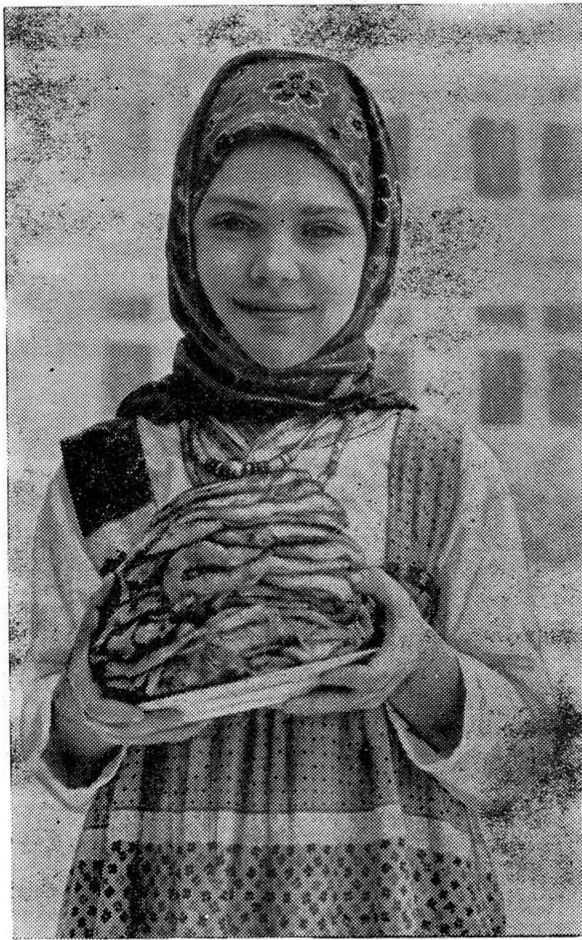
Празднуем Масленицу!

Хороша ты, масленица! Почти языческим обрядом заканчивался праздник. В самый канун весны провозили по всему селу, по всем закоулкам, а после сжигали, а