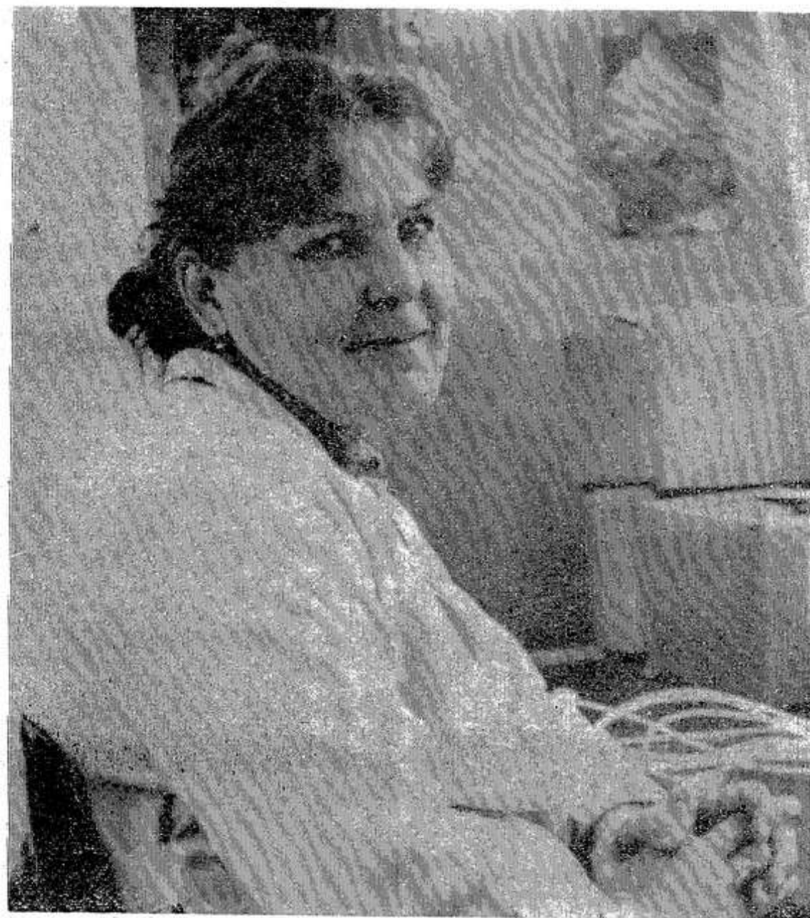
Самые добросовестные, самые умелые рабочие отделения завода АТС имеют право работать с личным клеймом. В