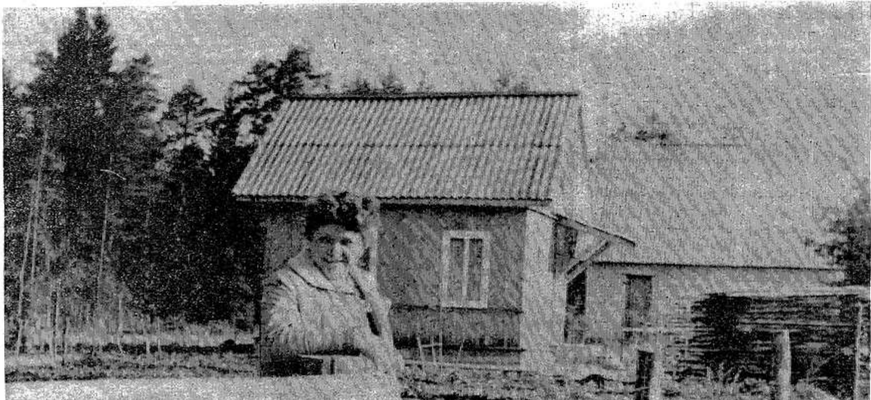
На даче всегда хорошее настроение.

Еще один совет по выращиванию лука. Если лук выращивается на репку, то не следует у него обрывать перья для еды. Это способствует загниванию чешуек, такой лук плохо хранится зимой.