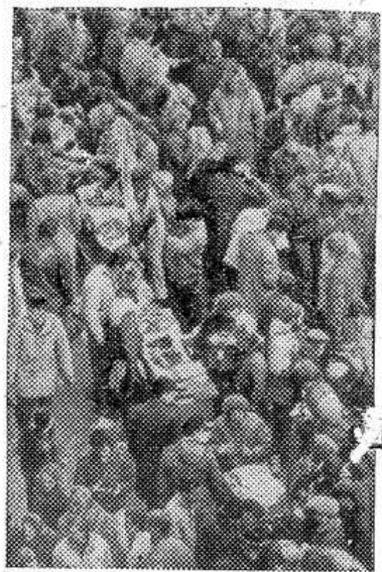
Вот и дождалась: Москва вполне напоминает оживленную торговую стихию портовый город.