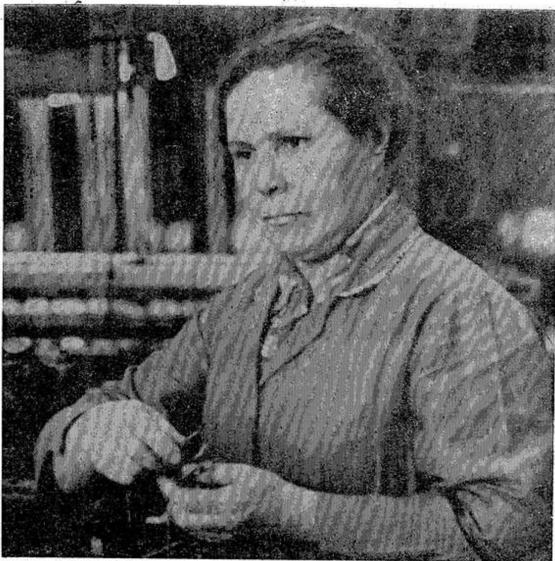
Хорошим качеством отличается продукция, произведенная ткачихой филиала Санкт-Петербургского текстильно-галан-

Л. ГОРЯЧЕВ, председатель комитета по земельной реформе и земельным ресурсам.