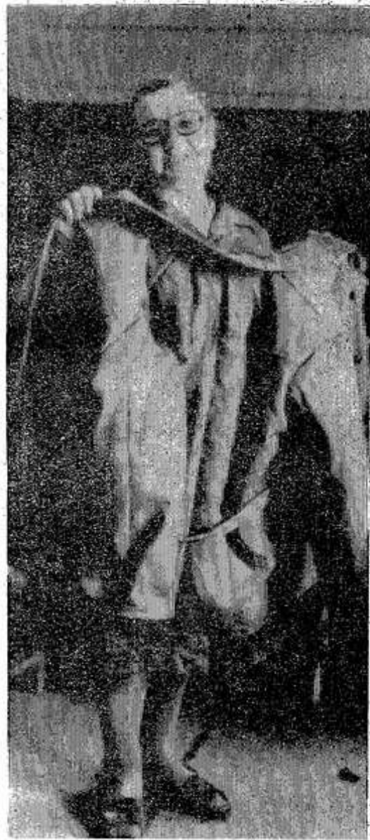
Новую модель фуфайки выпускает Красногородская швейная фабрика. Ее стоимость с торговыми и прочими накрутками 900 рублей.