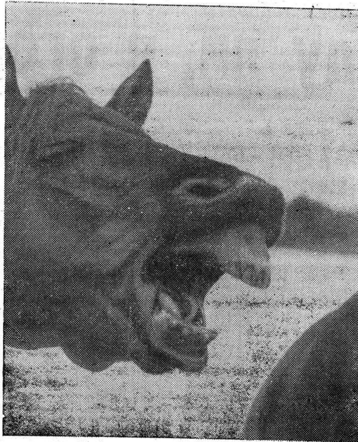
Овса-а-а... (Новгородская область).

Рыба не будет пахнуть тинной, если добавить ее в крепком холодном растворе соды или за час до варки положить в воду с уксусом (2 ст. л. уксуса на 1 л воды).