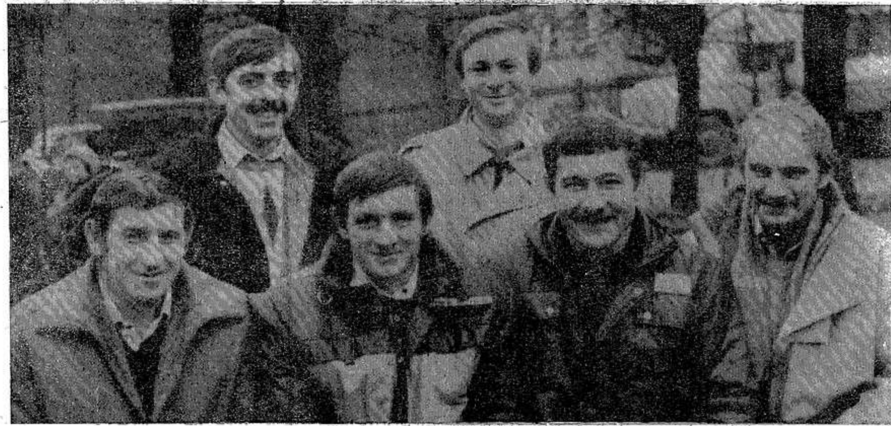
Участники праздника тружеников села из колхоза «XXI партсъезд». 16 ноября 1991 г.