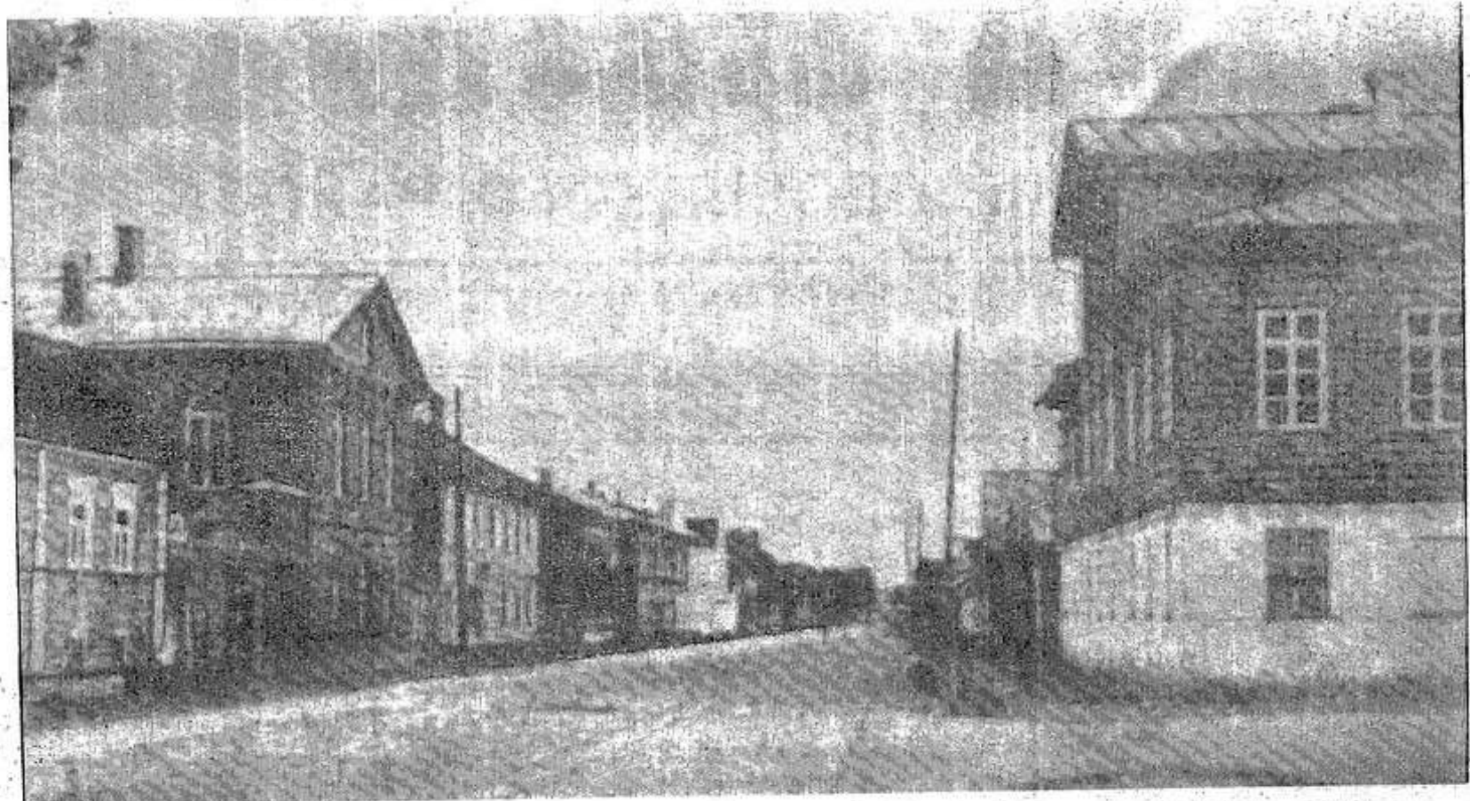
Великолукская улица. Направо — уездный съезд, налево — земская управа (белое здание).