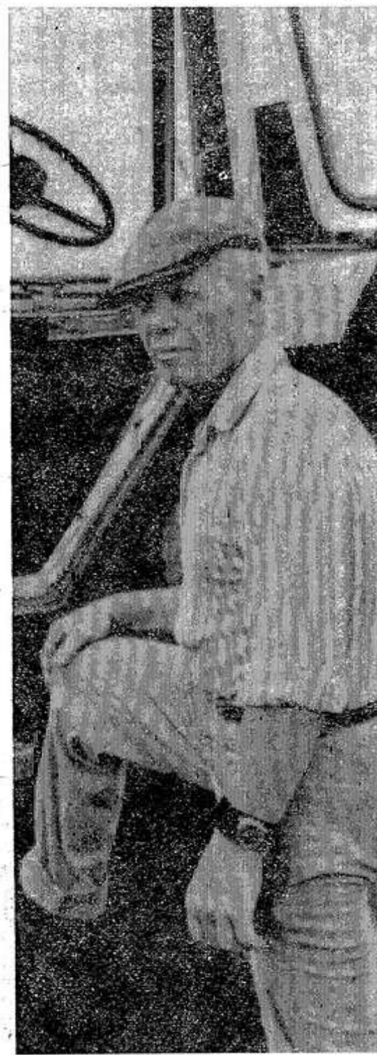
внимание ей — картошке. Е. ПУЛЬША.

Картошку не зря называют вторым хлебом. Без нее трудно представить небогатый сегодняшний стол. Отсюда такое