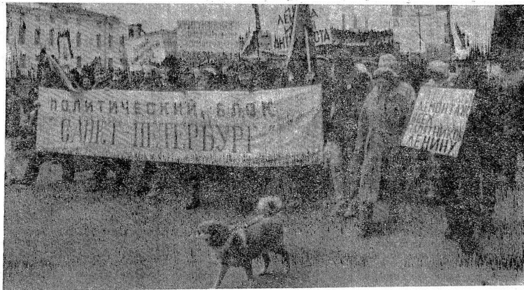
НА СНИМКЕ: демонстрация, организованная Демократическим союзом в ноябре.

Кажется, пошла на убыль волна митингов, демонстраций, которых было достаточно еще летом и осенью. Такое впечатление от Ленинграда, что пришла пора очередей. Правда, они настолько велики и часты, что можно говорить с известной поправкой о трансформации и перемещении митингов в