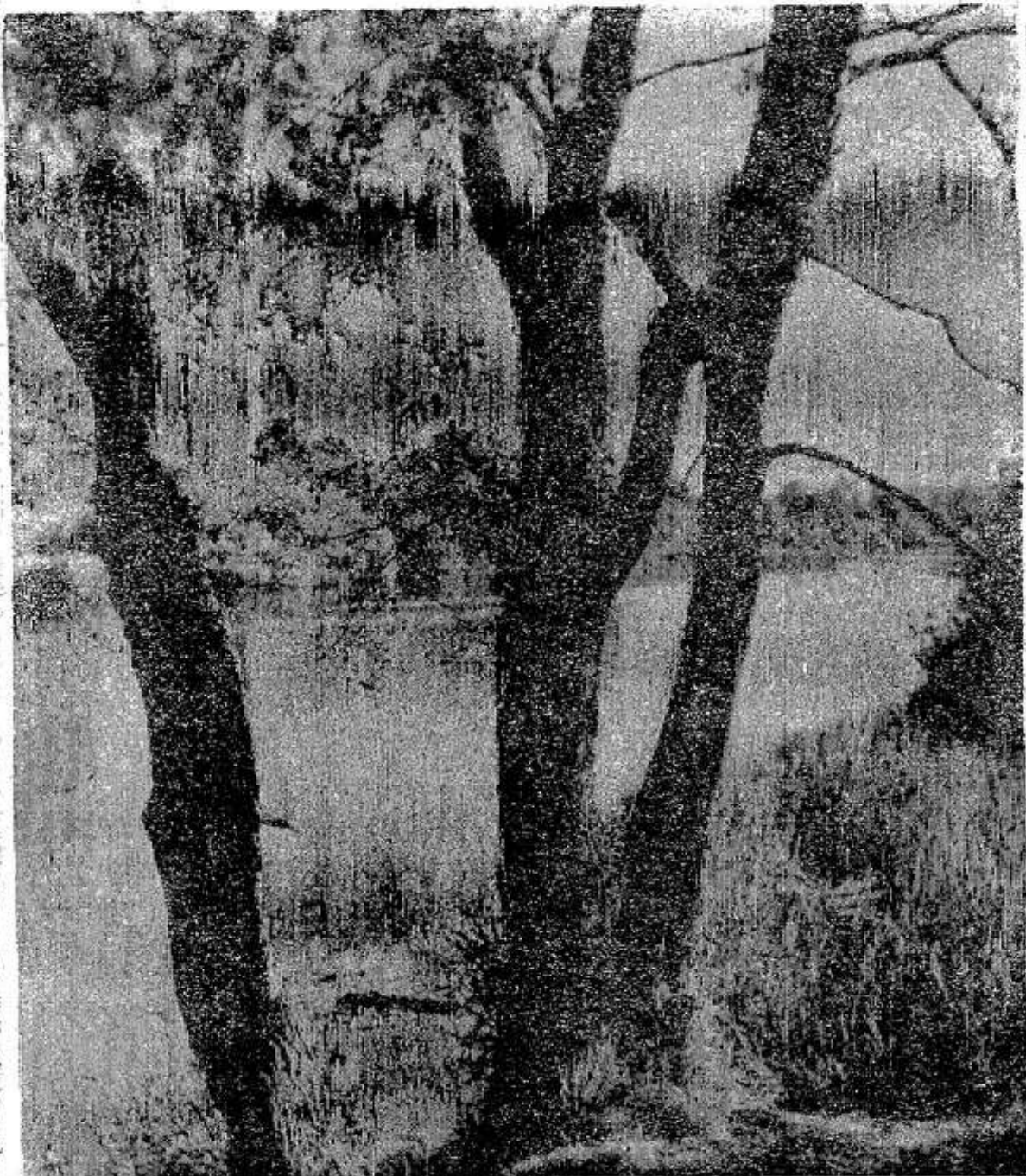
Утро на Вединой.