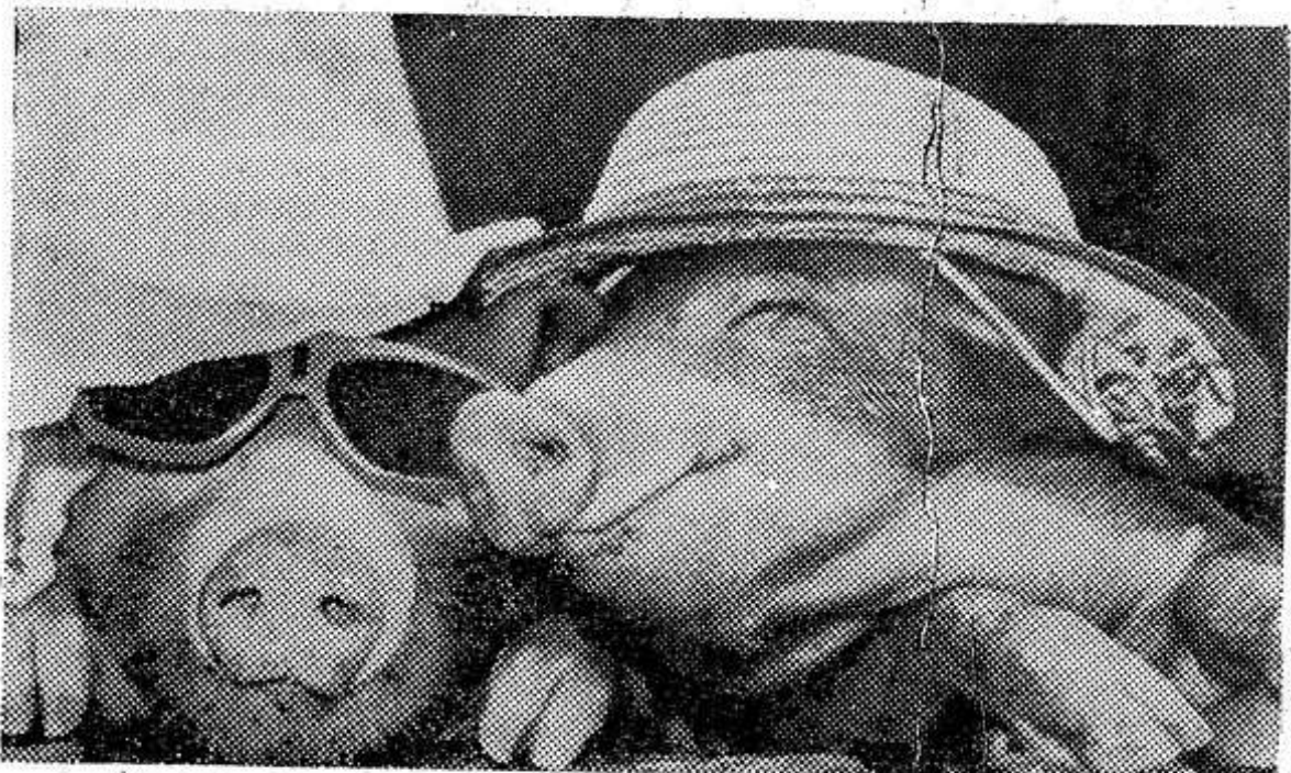
Солнышко пригрело... (сценка в одном из зоопарков Англии).

Вокзал. Давка. Мат. Вдруг — увидел поэта: Стоял он — асфальт Ковырял сандалетом. В брючатах несвежих, В разводах от пятен, Но взглядом — так нежен И сердцем — опрятен. Смотрел на прохожих Открыто, любя. И чем-то похоже, Как я на тебя.