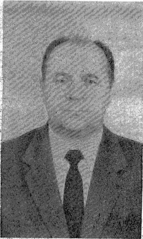
совершенствование социалистического общества.

— Я выступаю за широкий плюрализм мнений в рамках КПСС. Но тем не менее, считаю возможным поддерживать все движения и общественные формирования, деятельность которых направлена на дальнейшее