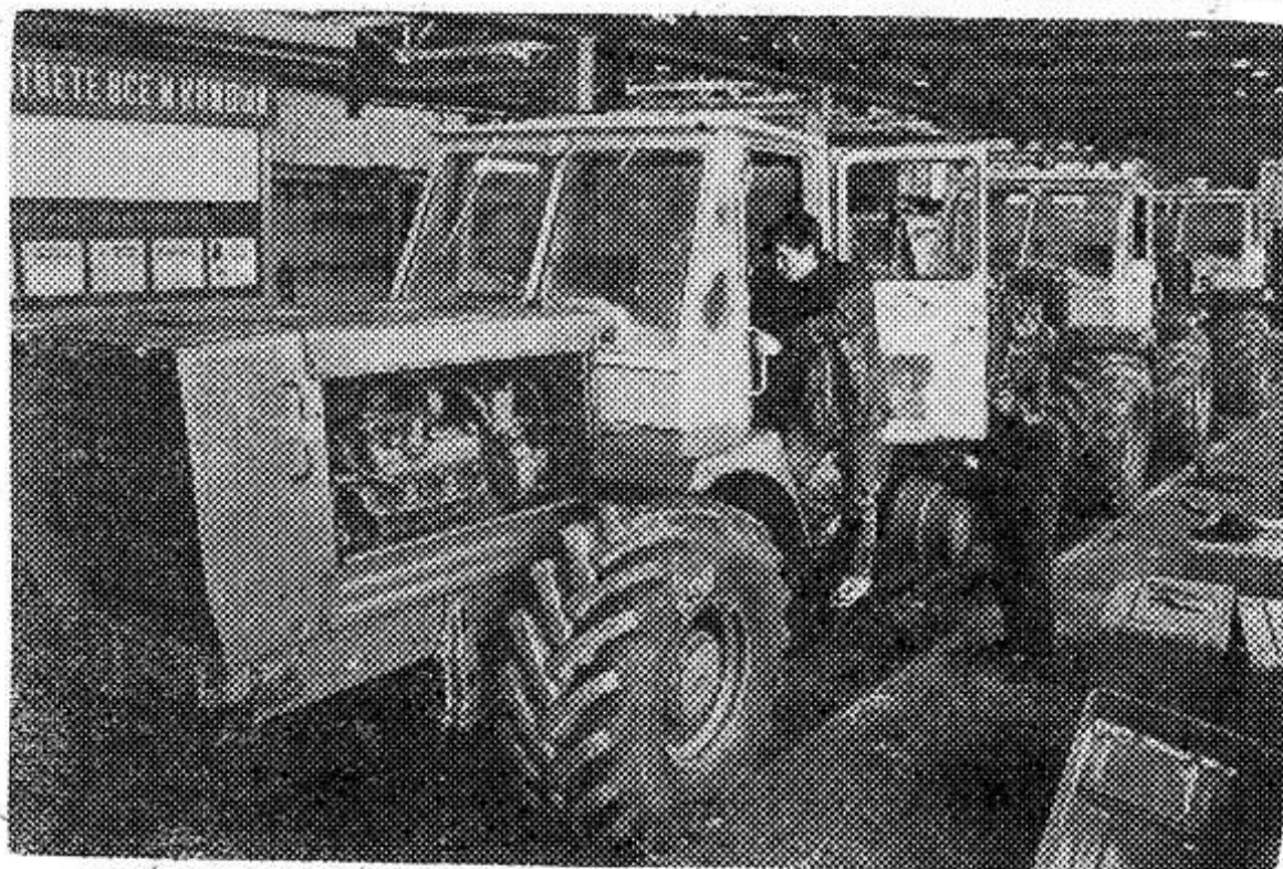
Украинская ССР. Система «Агротехтрактор» на базе Васильевского ремонтно-транспортного предприятия соз-