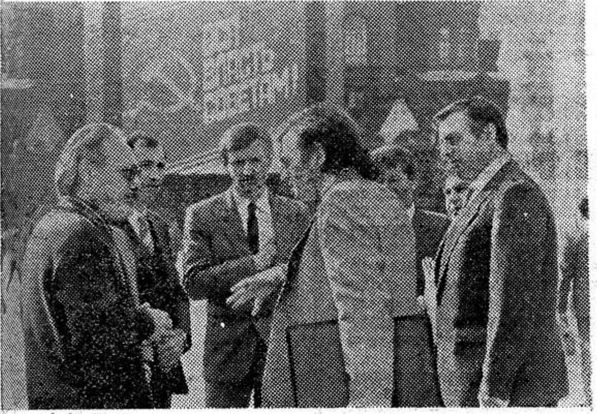
Москва. Кремль. Съезд народных депутатов СССР. НА СНИМКЕ: депутаты из Молдавии, Армении и Украины на Красной площади.