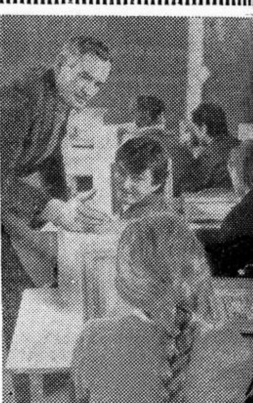
Украинская ССР. В средней школе совхоза «Сад Подолья», что в Винницкой области, действует вычислительный учебный комплекс новой серии «Электроника МС-0202».