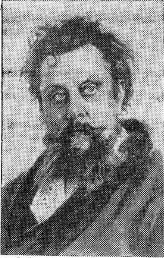
НА СНИМКЕ: М. П. Мусоргский. Портрет художника И. Е. Репина.

21 марта — 150 лет со дня рождения М. П. Мусоргского (1839—1881), русского композитора.