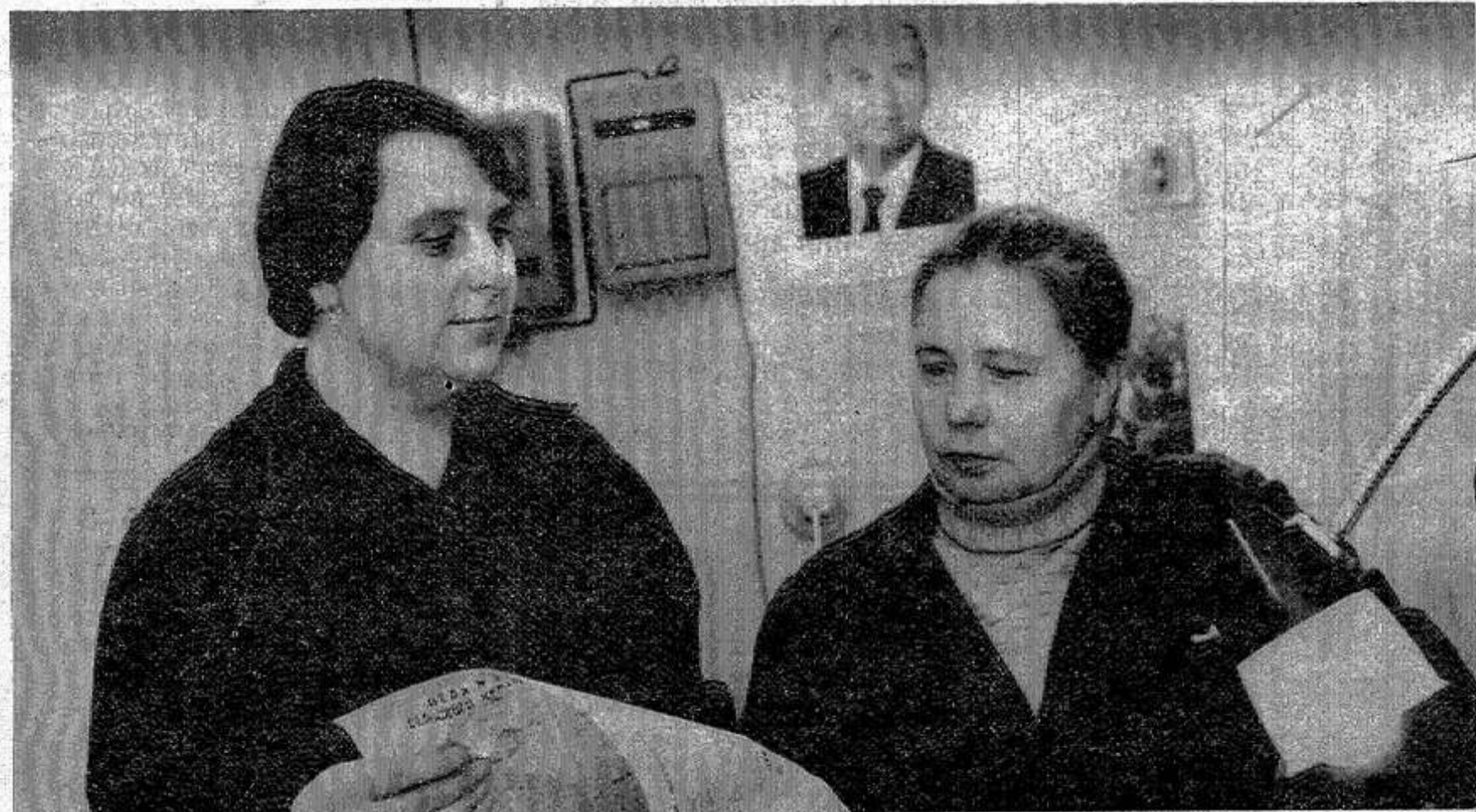
Неплохо работает в типографии группа народных контролеров, возглавляет которую коммунист набор-