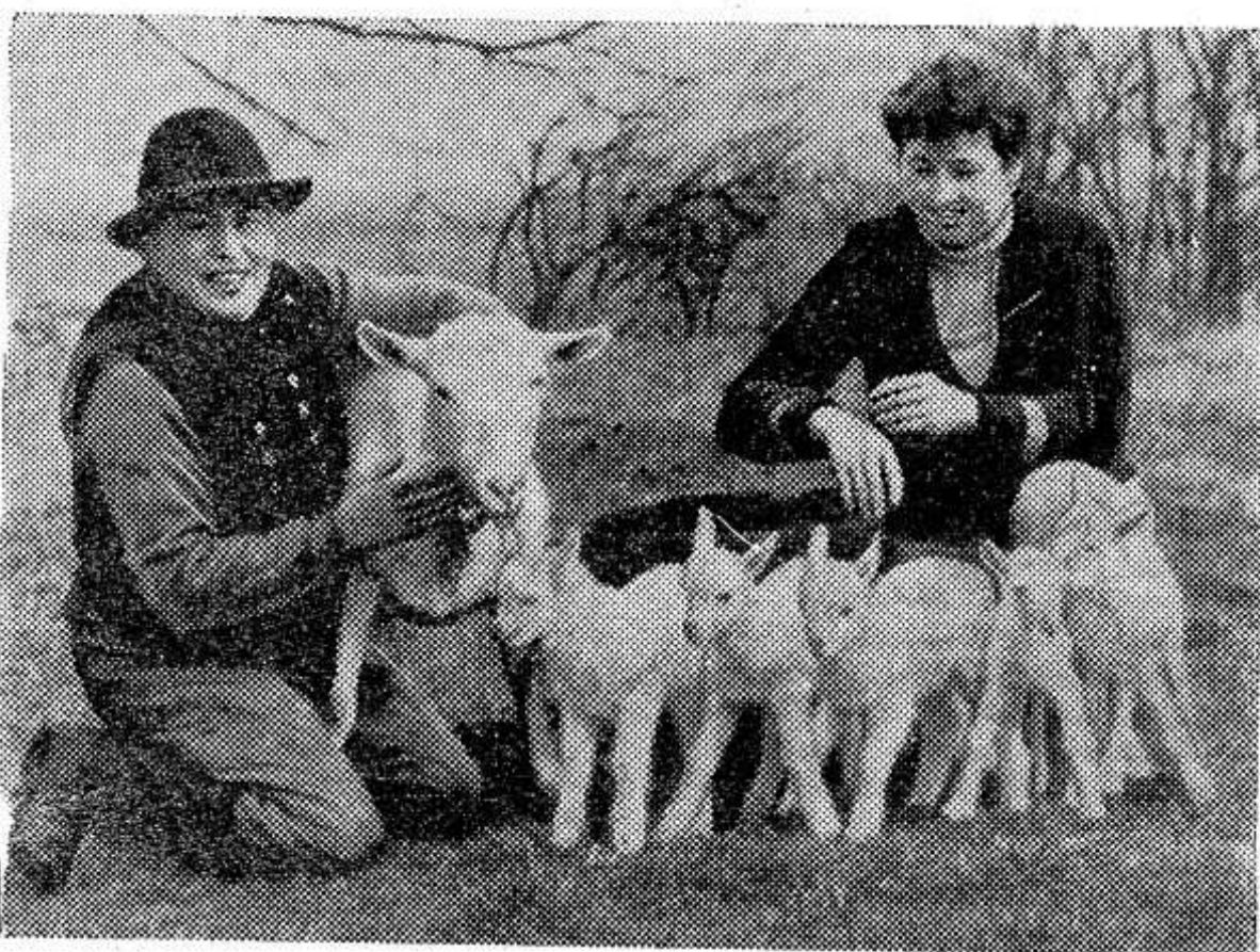
ГДР. Большую радость переживают супруги Гае из Гневсдорфа (округ Шверин): на их дворе появились сразу пятеро очаровательных су-

Чтобы во время прогулки вас не кусали комары, надо взять на кусочек бумаги каплю анисового масла и, когда масло расплывется, потереть лицо и руки. Анисовый запах отпугивает комаров, мух, разных мошек.