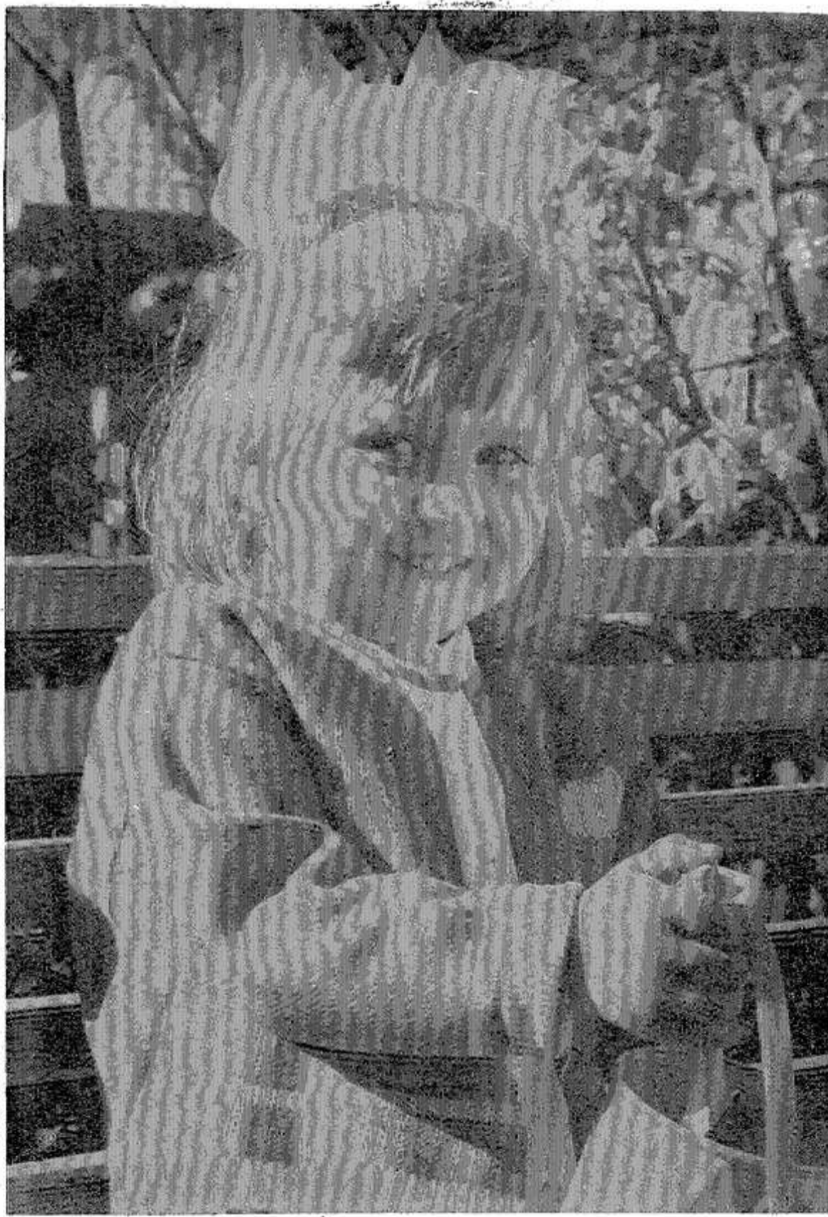
Светланка из «Светлячка».