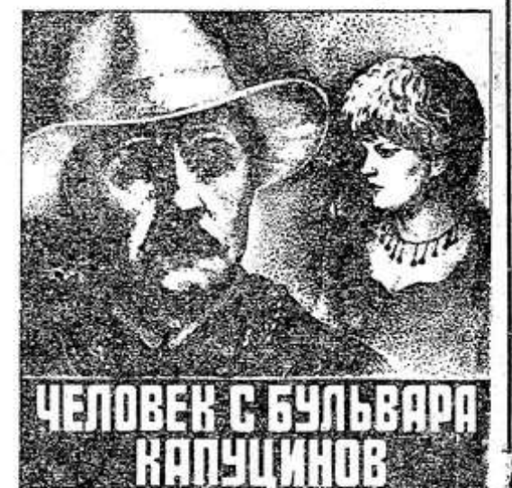
ЧЕЛОВЕК С БУЛЬВАРА КАПУЦИНОВ