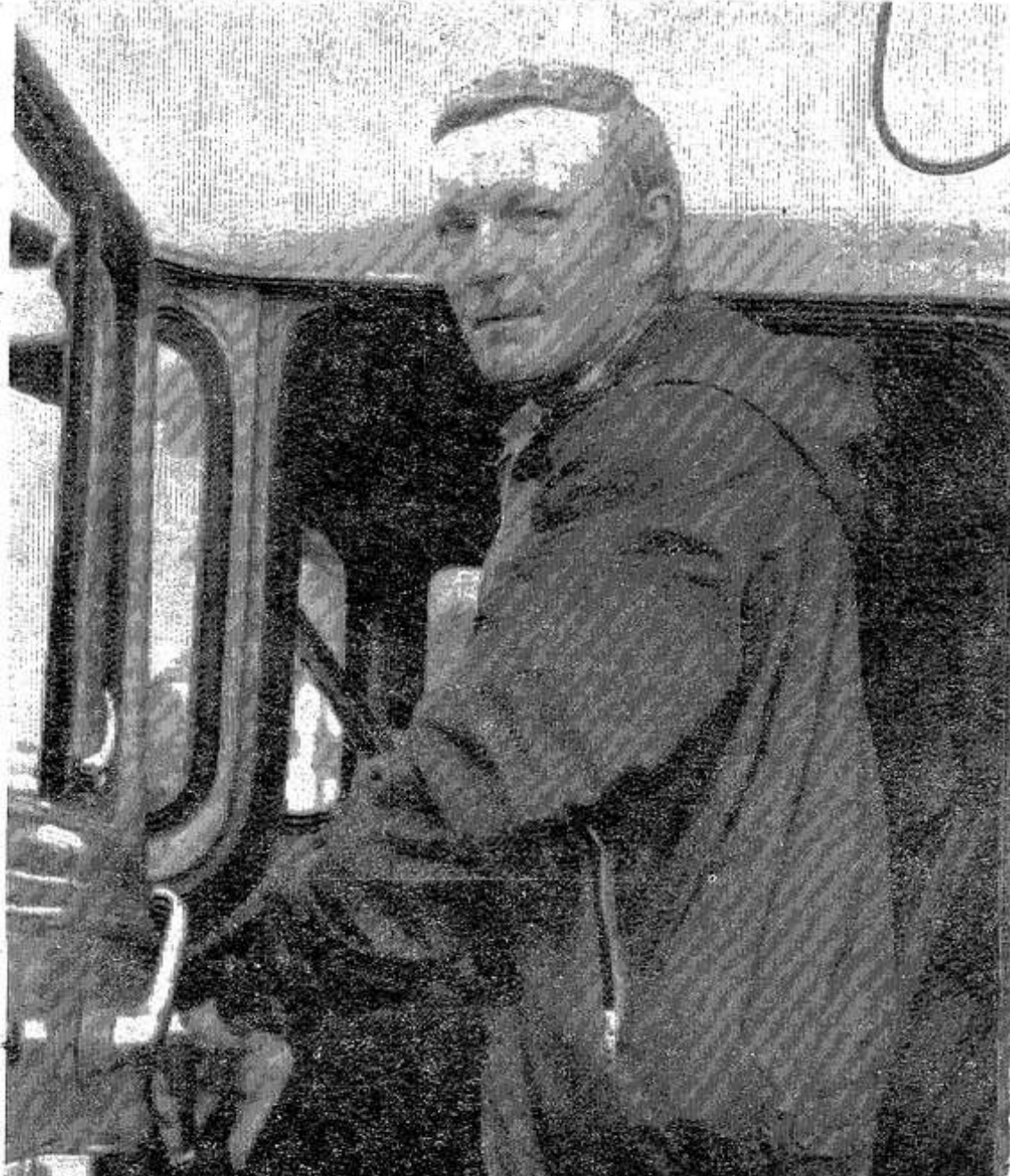
Ощутимую помощь в сельскохозяйственных работах труженикам колхозов и совхозов района оказывают горожане. В числе их и шофер Опочецкого ремонтно-техни-

Подробный отчет о работе сессии городского Совета народных депутатов будет опубликован в одном из ближайших номеров нашей газеты.