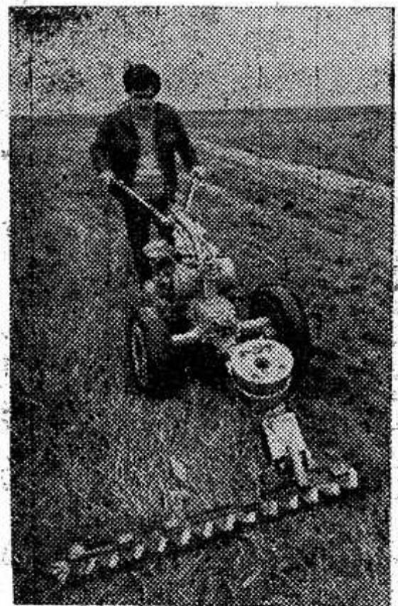
Белорусская ССР. Серийный выпуск модернизированных травяных косилок для мини-трактора «МТЗ-0,5» освоен на заводе «Светлогорскорммаш» производственного объединения «Томсельмаш». Они предназначены для работы на приусадебных участках.