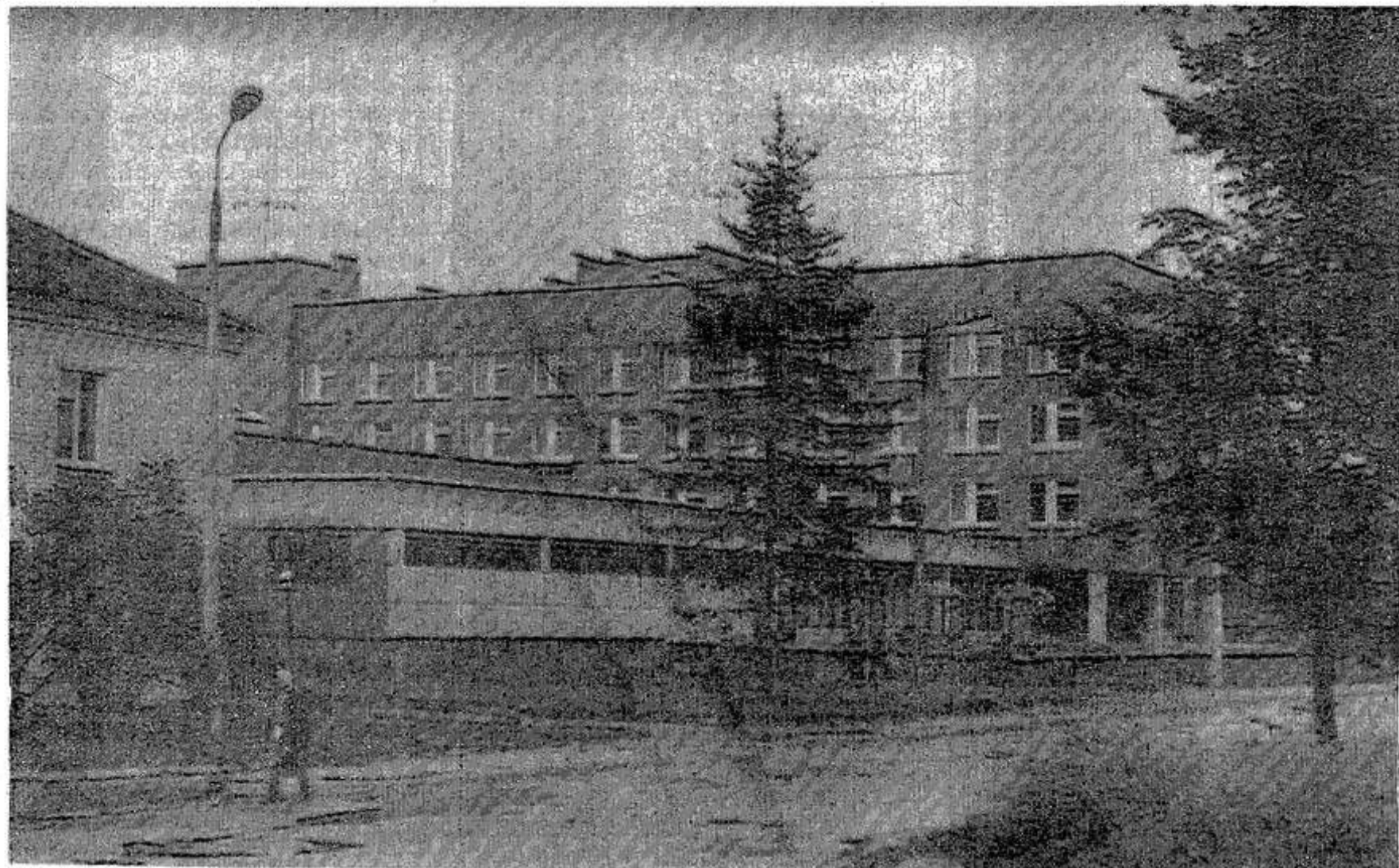
Опочка: здание гостиницы.

нашей области радиологической лабораторией проведены радиометрические анализы лесных грибов и ягод, которые показали отсутствие какого-либо радиоактивного заражения и полную их пригодность для употребления в пищу в неограниченном количестве.