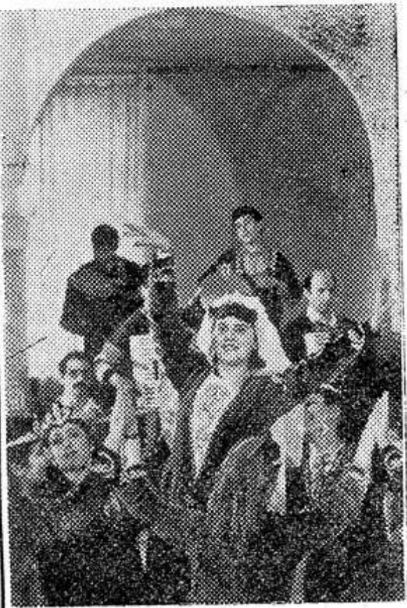
Выступает ансамбль народного танца Кироваканского Дома культуры «Химик».

В распоряжении детей швейников — детский сад «Космос» с плавательным бассейном, спортивные и игровые площадки, автогородок. В одном из живописных уголков района расположены пионерлагерь и пансионат.