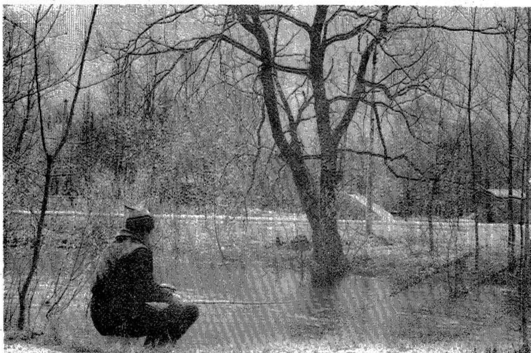
Рыбалка на реке Великой.