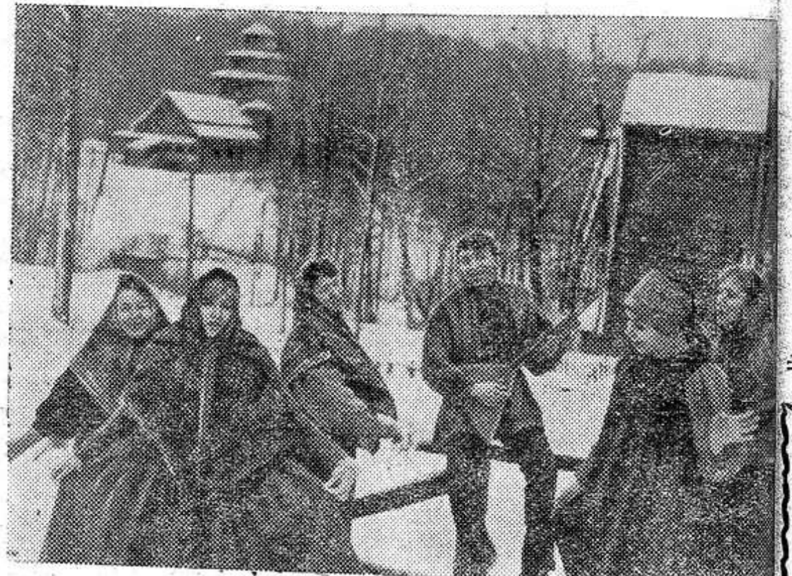
«Берегиня» — такое название получил самодельный фольклорный ансамбль, созданный при Горьковском музее архитектуры и быта народов Нижегородского Поволжья. В нем участвуют люди разных профессий — педагоги, студенты и служащие. Всех их объединяет лю-