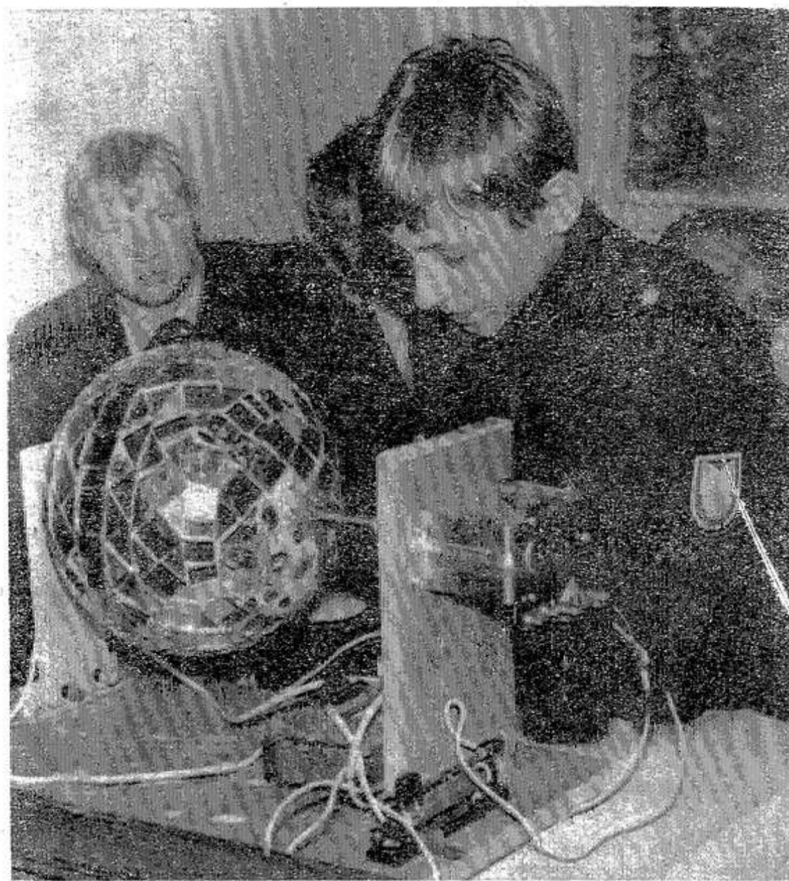
На выставке технического творчества в районном Доме пионеров.