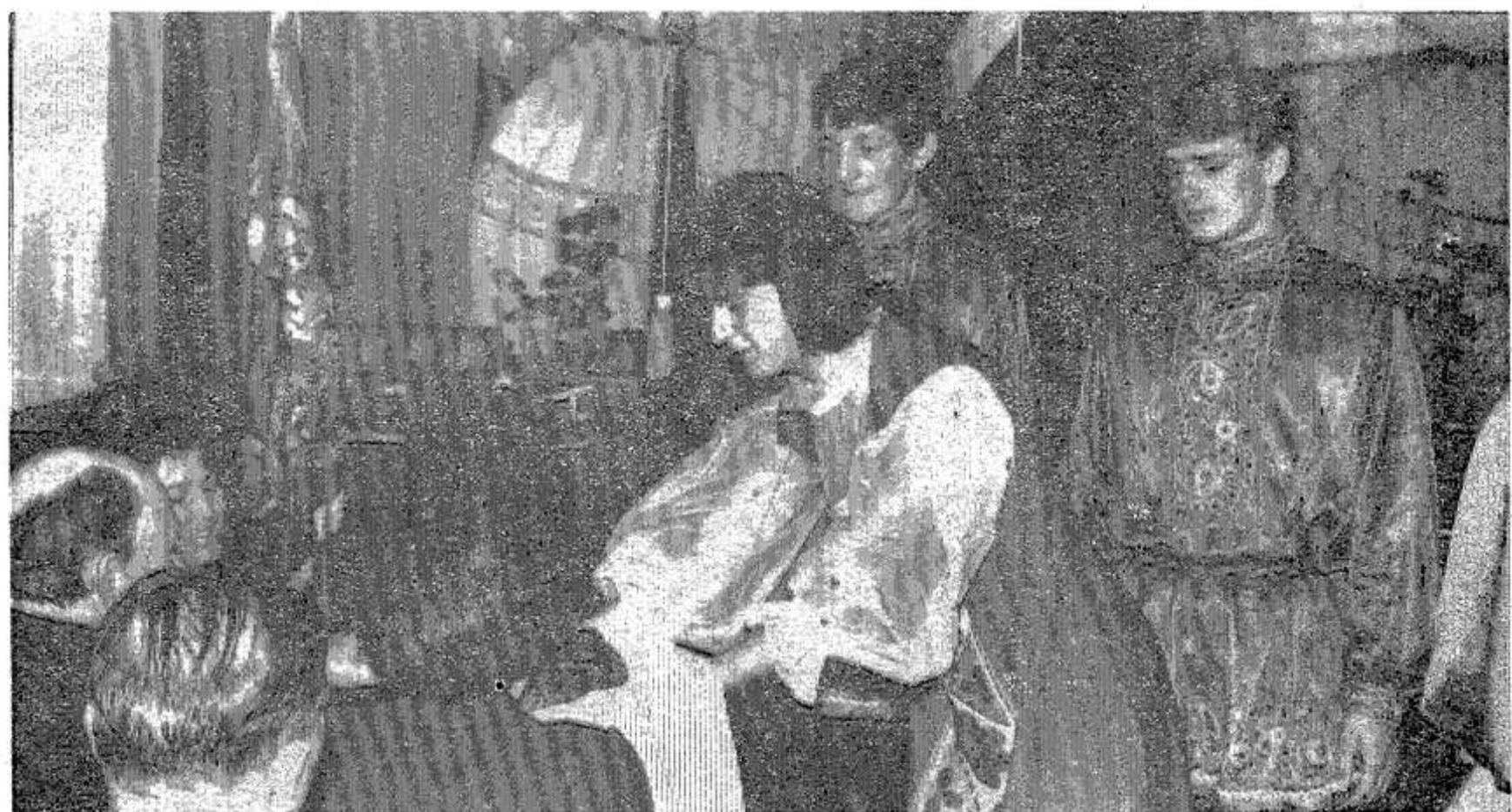
Участников слета чествуют хлебом-солью.