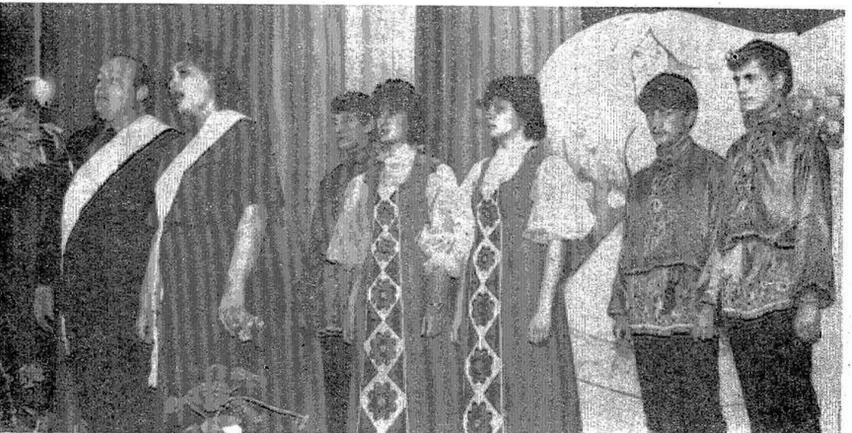
На сцене — участники художественной самодеятельности районного ДК.