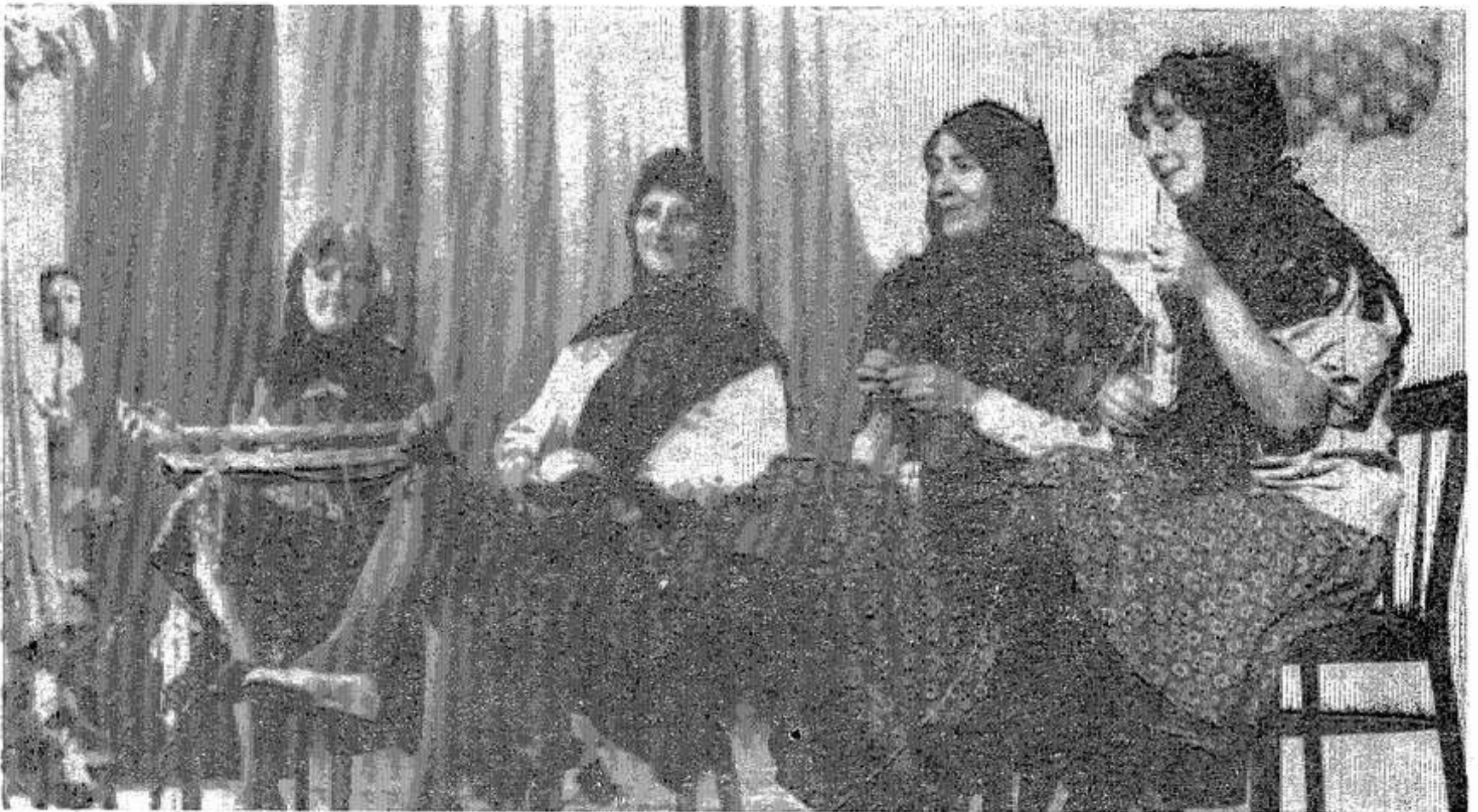
Коллектив самодеятельных артистов из колхоза «Красный Октябрь».