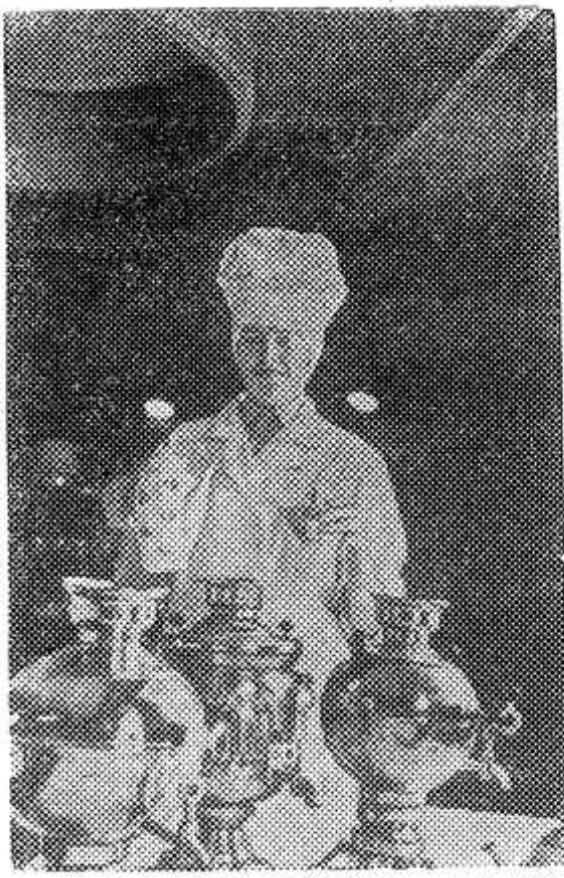
Брестская область. Кафе-столовая «Нива» открылось на крупном животноводче-

Пожалуй, одно из самых необычных изданий в мире выходит в швейцарском городе Лозанне. Это каталог... украденных произведений искусства. Издает его международная организация по розыску похищенных произведений искусства. В каталоге наряду с репродукциями картин указываются владельцы, а также адреса фирм, которые подозреваются в перепродаже украденного.