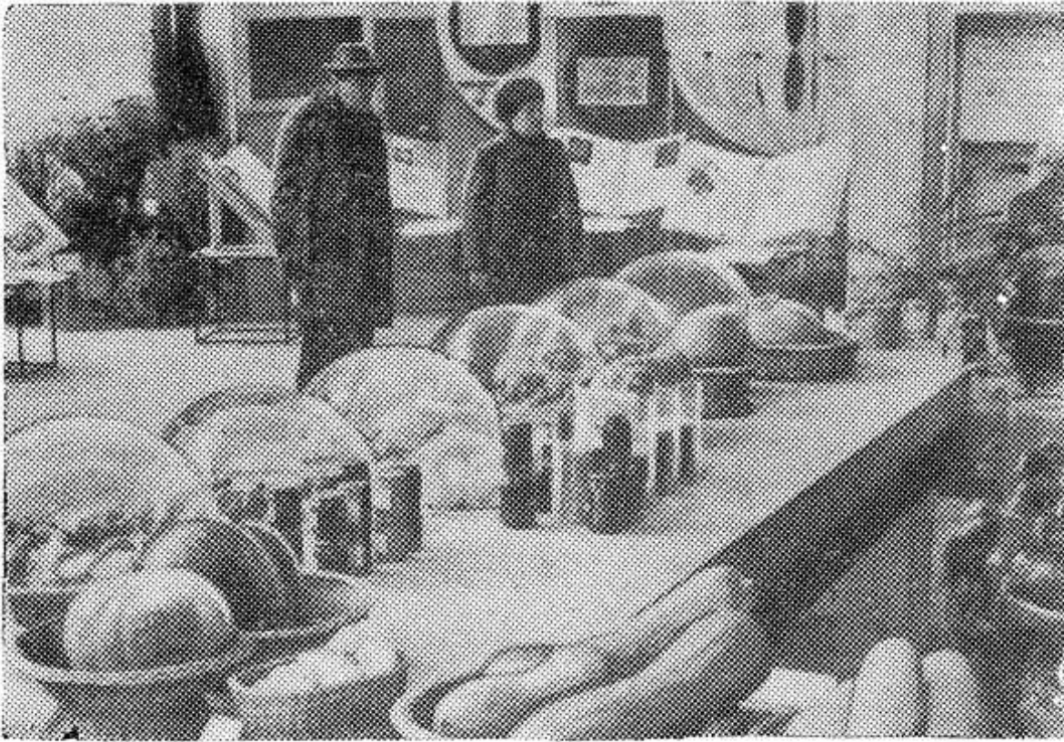
МОСКВА. На Выставке достижений народного хозяйства СССР в павильоне «Семена» широко представлена тема развития производства овощей на приусадебных участках и в садоводческих товариществах.