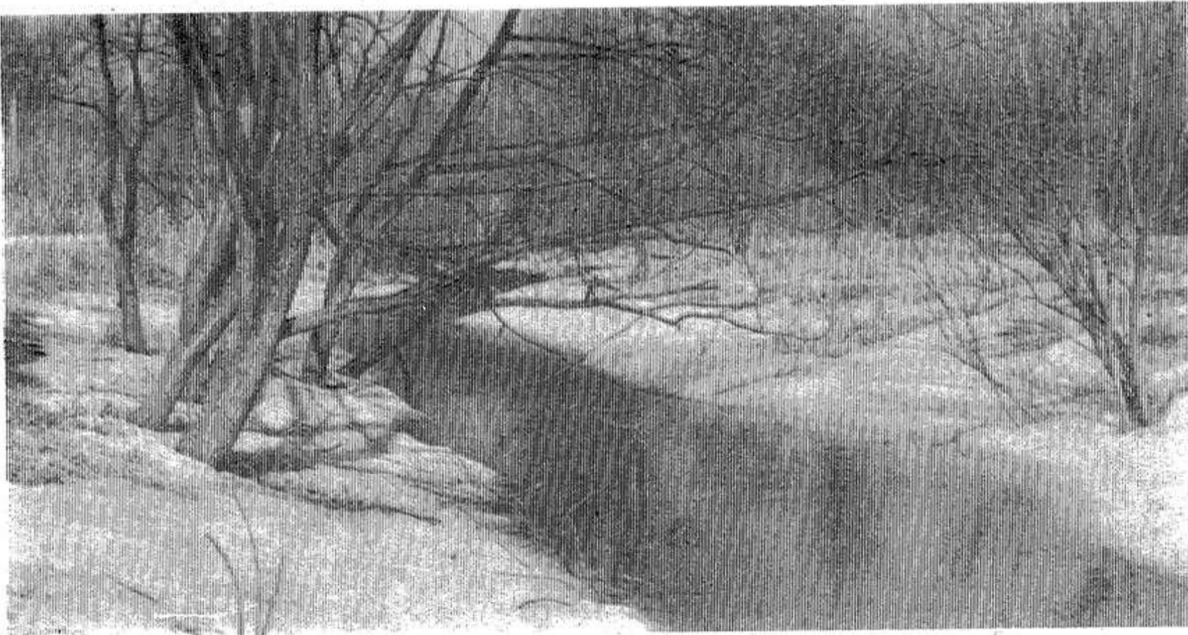
Над тихой речкой.