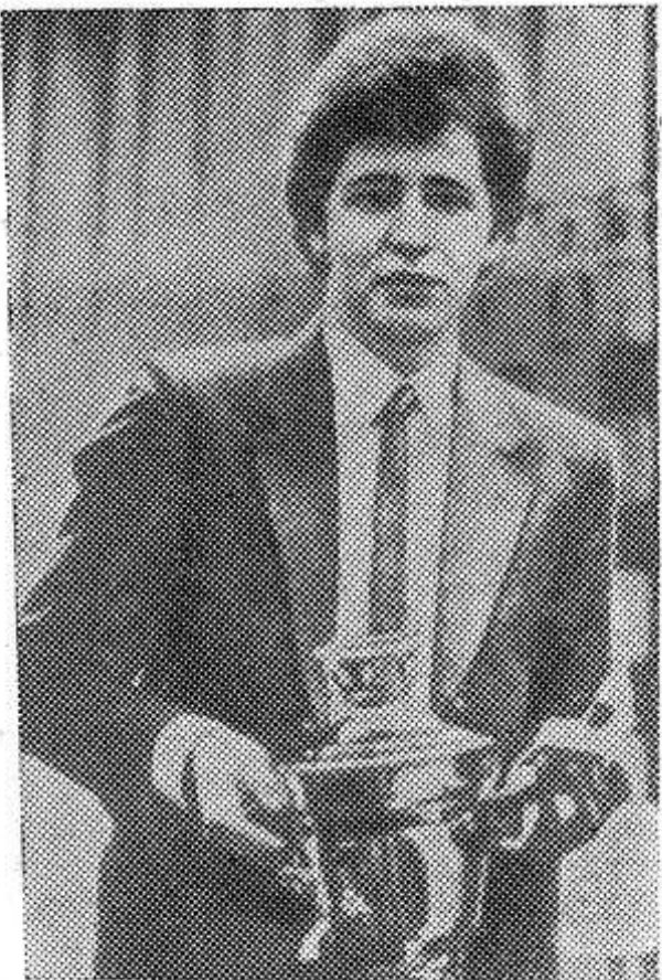
В Минске завершился полуфинальный матч претендентов на первенство мира по шахматам между Андреем Соколовым и Рафаэлом Ваганяном. Победил Соколов — 6:2. НА СНИМКЕ: А. Соколов с сувениром.