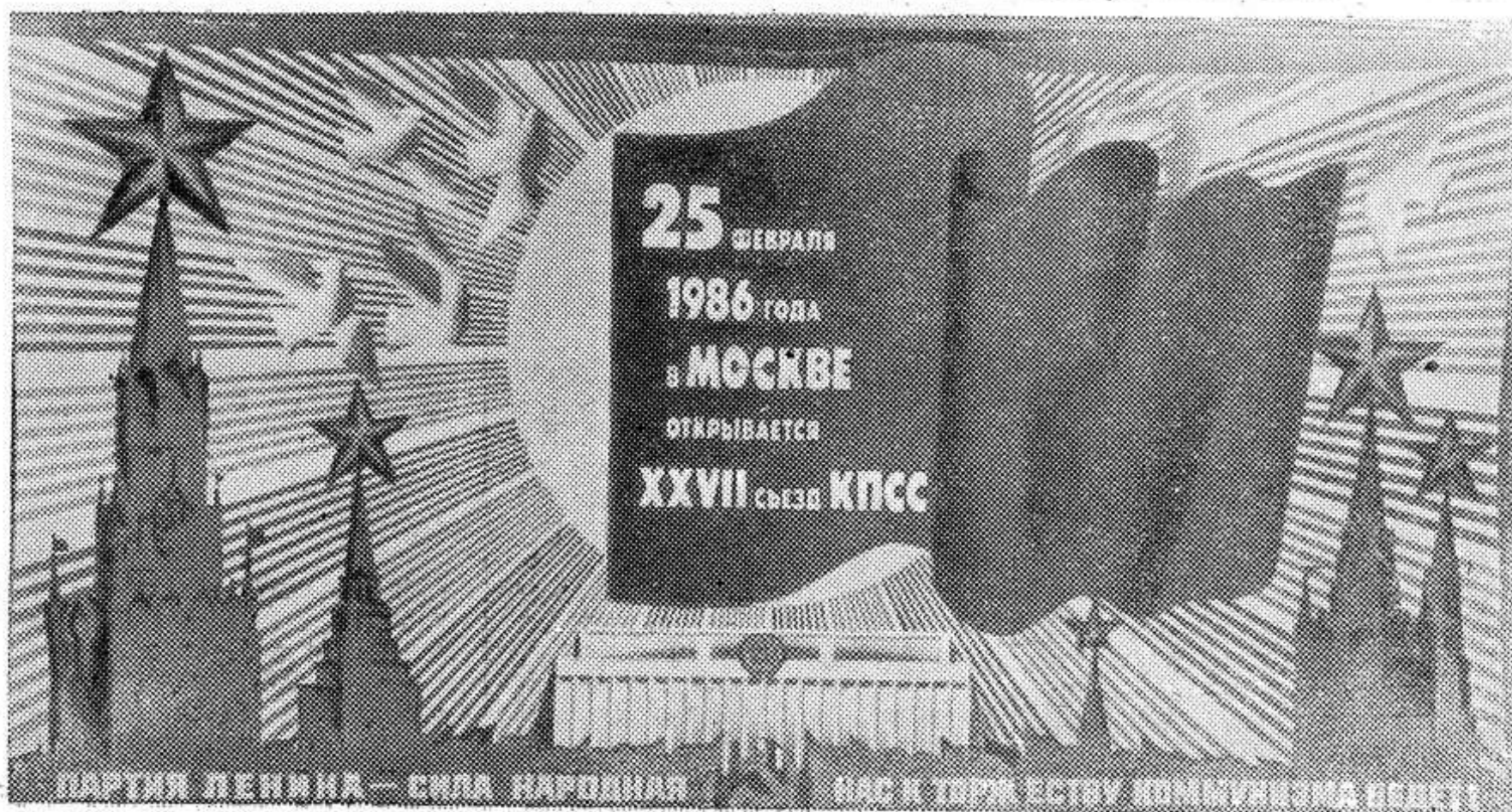
Плакат художника О. Маслякова.