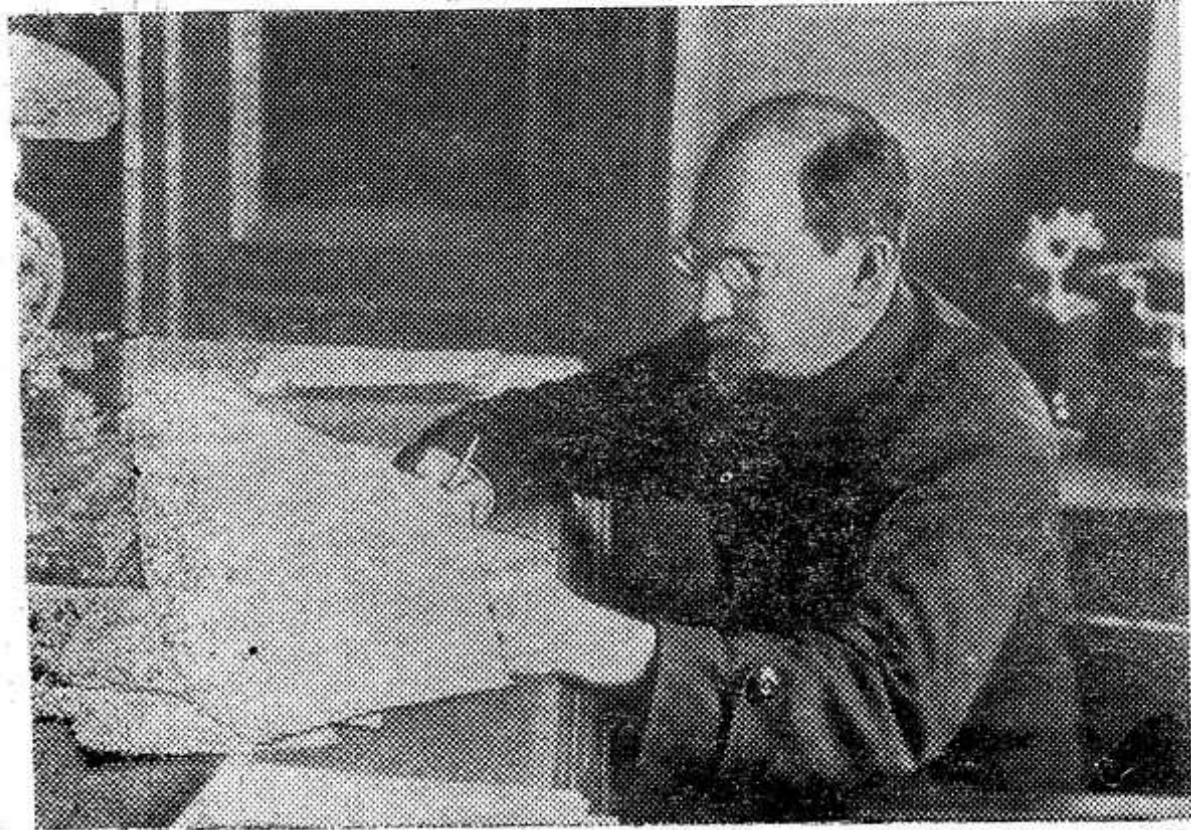
Анатолий Васильевич Луначарский в своем рабочем кабинете (1922 год).

23 ноября — 110 лет со дня рождения А. В. ЛУНАЧАРСКОГО (1875 — 1933), советского государственного и партийного деятеля, литератора.