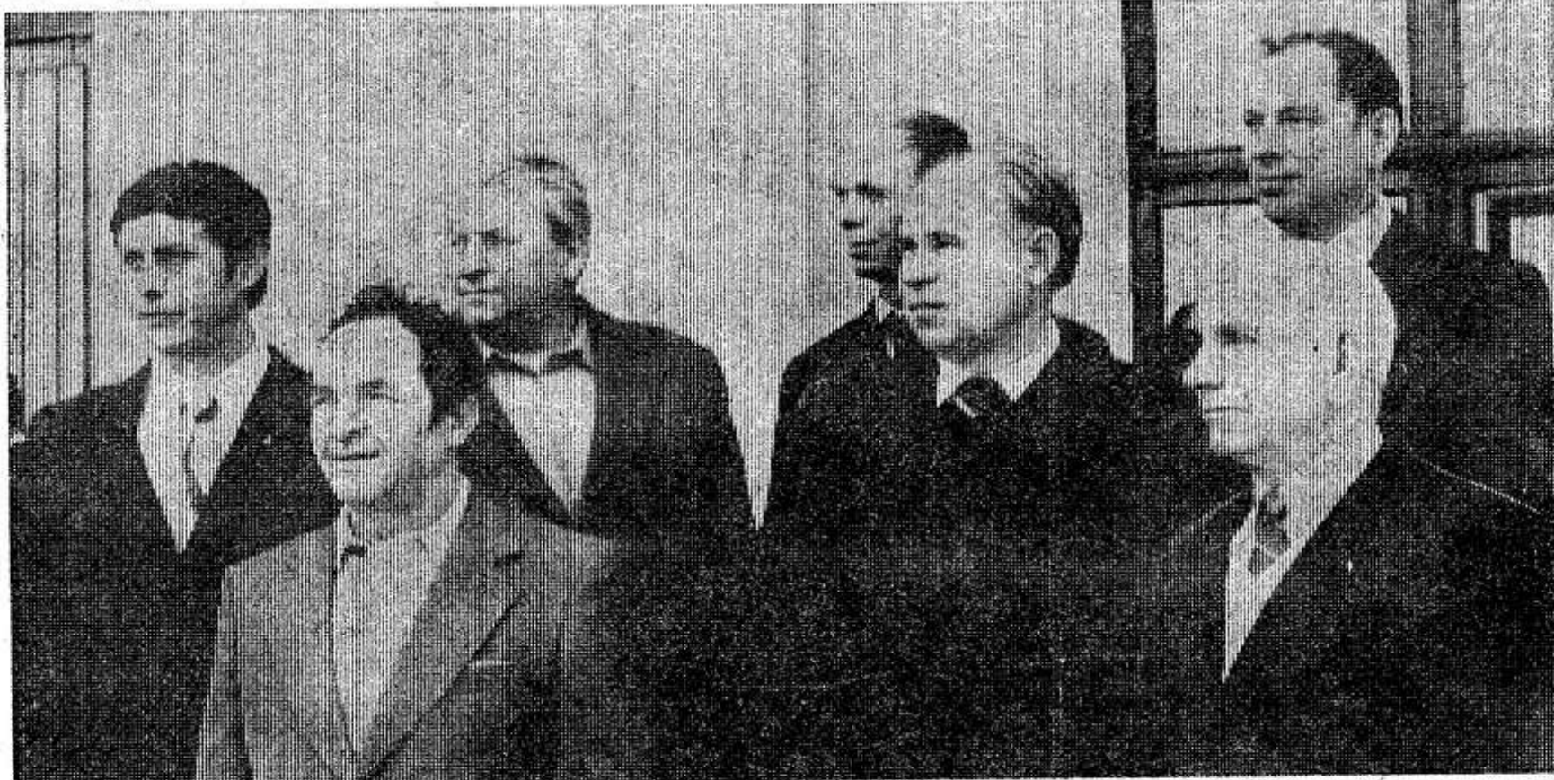
НА СНИМКЕ: делегация автоколонны № 1662.

В отчетном докладе райкома КПСС отмечены положительные результаты, достигнутые колхозами и совхозами в реализации Продовольственной программы. Важным дополнительным источником