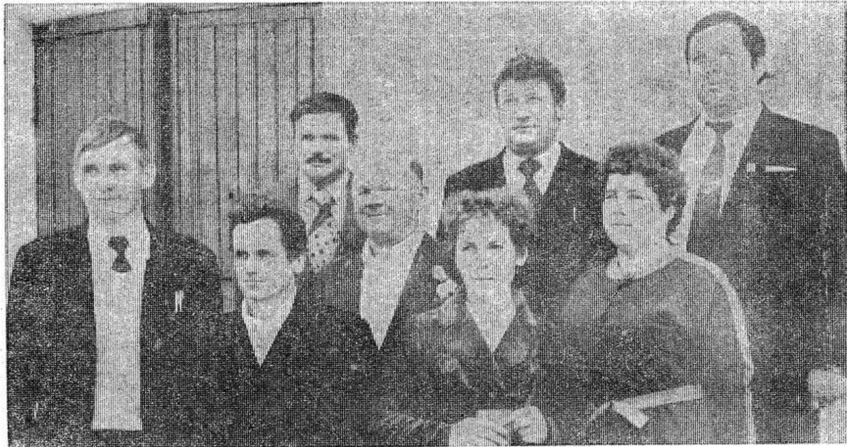
НА СНИМКЕ: члены делегации совхоза «Духновский».

надатую пятилетку. На колхозы и совхозы возлагается особая ответственность за наиболее полное использование имеющихся резервов, увеличение объема производства продукции, улучшение ее качества и снижение себестоимости. Путь к этому, прежде всего, в ускорении научно-технического прогресса во всех отраслях сельскохозяйственного производства, быстром внедрении разработок ученых и передового опыта.