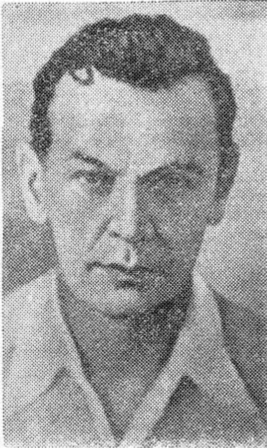
Рихард Зорге — Герой Советского Союза, советский разведчик.

4 октября — 90 лет со дня рождения РИХАРДА ЗОРГЕ (1895 — 1944 гг.).