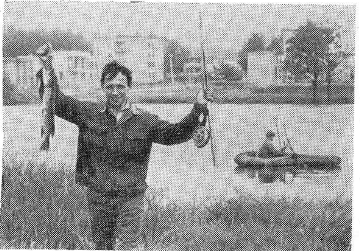
СМОЛЕНСКАЯ ОБЛАСТЬ. В колхозе «Заря» действует клуб трезвенников. В союз непьющих мужчин, как они себя называют, объединились механизаторы.