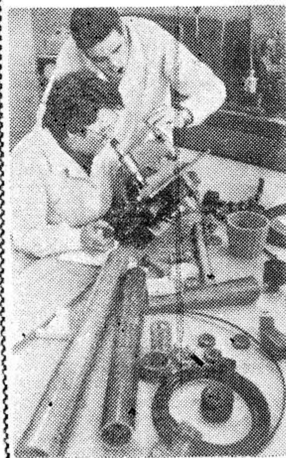
АЗЕРБАЙДЖАНСКАЯ ССР. Новый универсальный полимерный материал получен во Всесоюзном научно-исследовательском институте олефинов в Баку. Этот материал гораздо прочнее и эластичнее обычного полиэтилена.

Подробный отчет о работе сессии будет опубликован в одном из ближайших номеров нашей газеты.