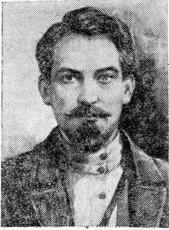
Н. А. Щорс. Рисунок художника П. Васильева.

6 июня — 90 лет со дня рождения Н. А. Щорса (1895—1919), героя гражданской войны.