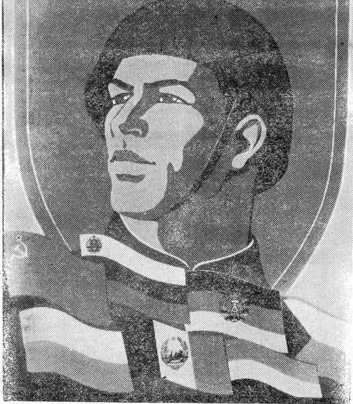
Плакат художника М. Гетмана.

ВОЕННО-ПОЛИТИЧЕСКИЙ ОБОРОНИТЕЛЬНЫЙ СОЮЗ СТРАН СОЦИАЛИЗМА ВЕРНО СЛУЖИТ МИРУ