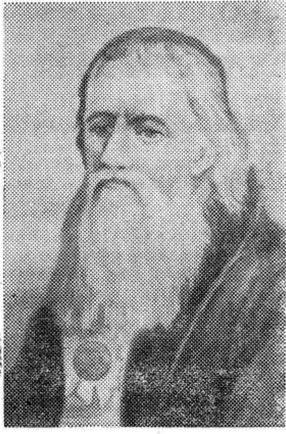
И. П. Кулибин.

К 250-летию со дня рождения И. П. КУЛИБИНА (1735-1818), русского механика-самоучки.