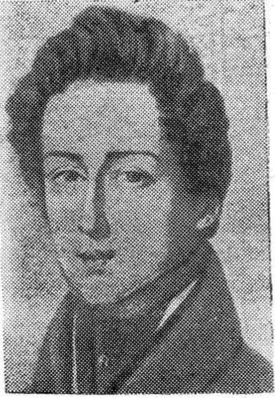
Фридерик Шопен, великий польский композитор.

К 175-летию со дня рождения Ф. ШОПЕНА (1810—1849 гг.)