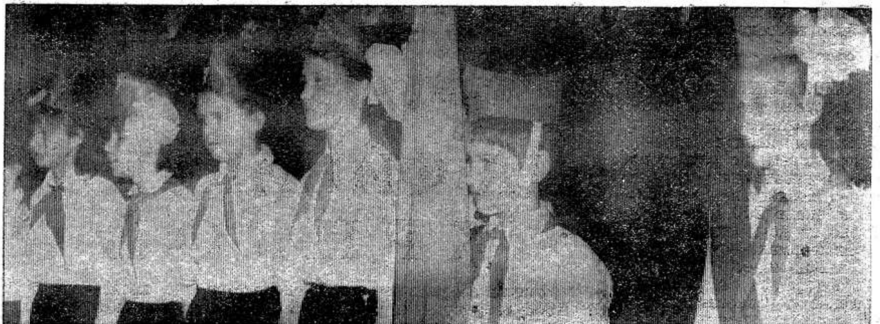
Делегатов и гостей конференции приветствуют юные ленинцы.

завода на выращивании картофеля и льна. Райком комсомола перед началом каждой сельскохозяйственной кампании разрабатывает условия соревнования, утверждаются составы коллективов. В течение трех лет создаются комсомольско-молодежные кормозаготовительные звенья в колхозах «Красный Октябрь», «Большевик», «Х. партсъезд», совхозе «Организатор». Отличными трудовыми успехами завершают