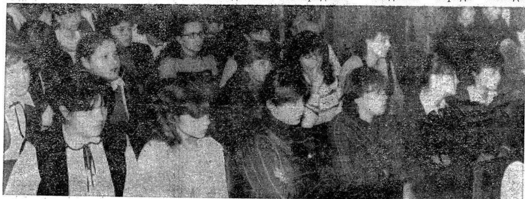
В зале — делегаты комсомольской конференции.

Сегодня районная комсомольская организация насчитывает в своих рядах 3400 комсомольцев. Значительно выросли по численности комсомольские организации ремонтного завода, РОВД, завода ЖБК, совхозов «Красный фронтвик», «Салют», колхозов «Вперед», «Урожай». Юноши и девушки объединены в 82 первичные комсомольские организации, 118 комсомольских организаций с правами первичных и 29 комсомольских групп.