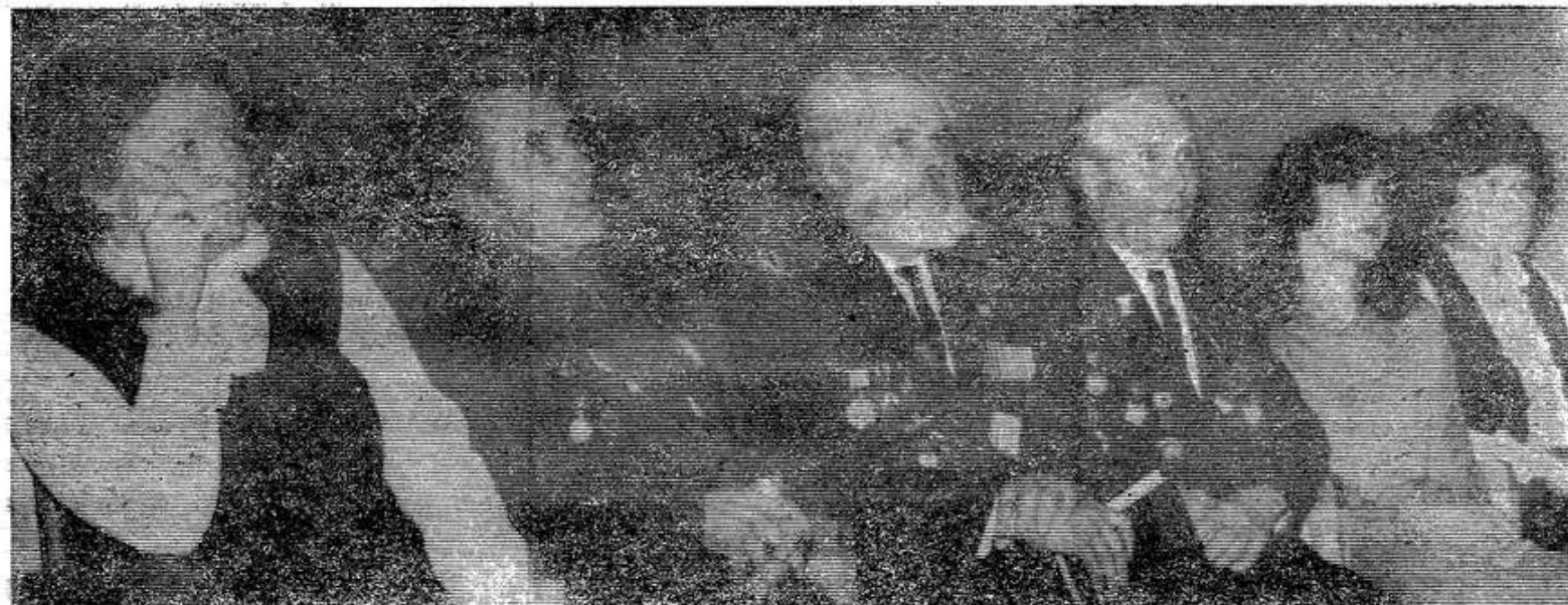
Среди делегатов конференции — ветераны партии и комсомола.

В этом году организации оказали большую помощь ребята из областного строительного отряда. Этому отряду было предоставлено жилье и все необходимое для проживания и отдыха. Однако в настоящее время в ПМК остался работать лишь один член строительного отряда. Из-за того, что у нас мало строится жилья, плохо организован отдых молодежи и более тяжелые условия труда, чем на других предприятиях, создается большая текучесть кадров. Юноши и девушки, ежегодно входящие в организацию по комсомольским путевкам, уходят с производства, проработав, к сожалению, только один год. Этот вопрос для нас сейчас самый важный, поэтому наша комсомольская организация уделяет ему первостепенное внимание.